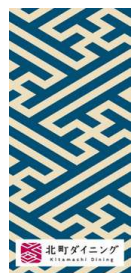
(法被、提灯、紗綾型フラッグイメージ)