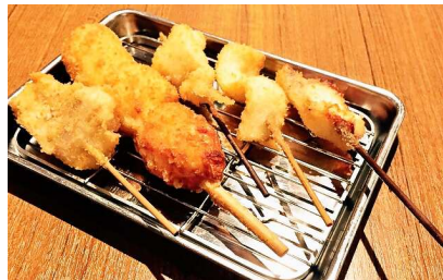
「海鮮セット（串5点盛）」 （華祭）