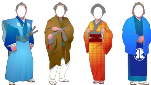
(顔出しパネルイメージ)

※法被は平日 20:30、土日祝 15:00 からの「北町タイム」の間のみ着用します。