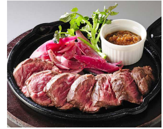
「ババットステーキスモールサイズ」 （オールドステーション）