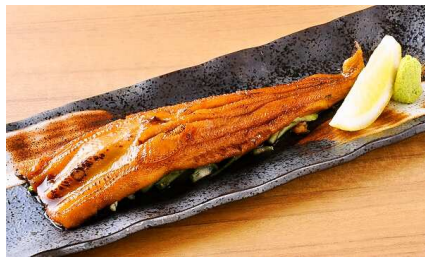
「ふんわり1本煮穴子」 （いろり庵）