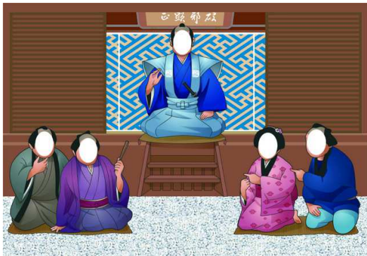
(お白洲パネルイメージ)

幅約4メートルの「お白洲パネル」をはじめ、江戸時代の雰囲気を楽しめる館内装飾が、北町奉行所の雰囲気を盛り上げます。