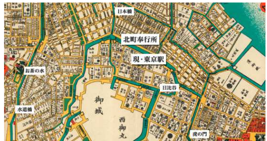
(歴史パネルより 江戸時代の古地図 イメージ)

「北町ダイニング」のある JR 東京駅は、江戸時代に北町奉行所があった跡地に隣接しており、「北町ダイニング」の施設名称やロゴデザインも北町奉行所や江戸時代に因んでいます。今回実施する館内装飾では、江戸時代(1860年)の古地図などを掲載したパネルを設置し、北町奉行所や江戸時代の文化を紹介します。