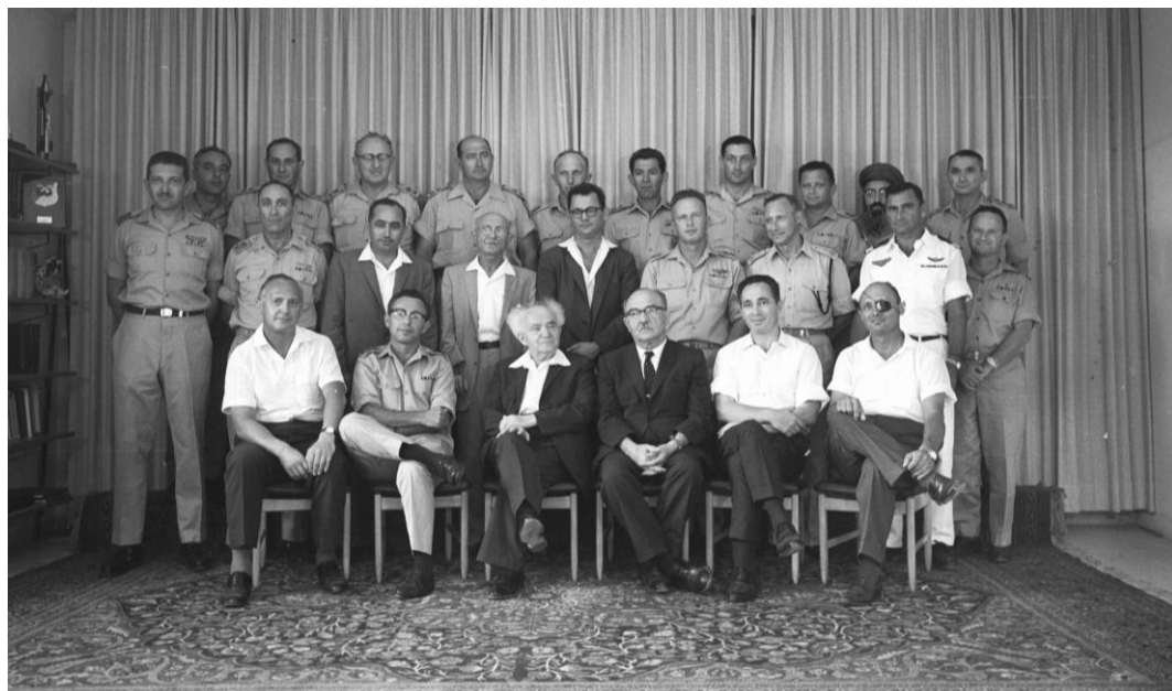
פורום המטה הכללי בראשות רב-אלוף צבי צור נפרד מראש הממשלה ושר הביטחון דוד בן-גוריון ב-3 ביולי 1963.

ודעתו של נאצר לא הייתה נתונה לגבול עם ישראל. הזירה העיקרית שהעסיקה את צבי צור כרמטכ"ל מן הבחינה המבצעית הייתה בחזית הצפון אל מול הסורים. בין ישראל לבין סוריה הייתה מחלוקת על מעמדם של כמה שטחים מפורזים שגורלם לא הוכרע על-ידי האו"ם, ומעת לעת הופרעה עבודתם של החקלאים הישראלים בתקריות ירי. גם המאבק על זכויות הדיג והשיט באגם הכנרת היה למוקד חיכוך בין הצדדים. בדרך כלל, התקריות עם הסורים היו מקומיות והתנהלו בעצימות נמוכה ללא הפעלת נשק כבד, אולם לכך היה חריג אחד. 41