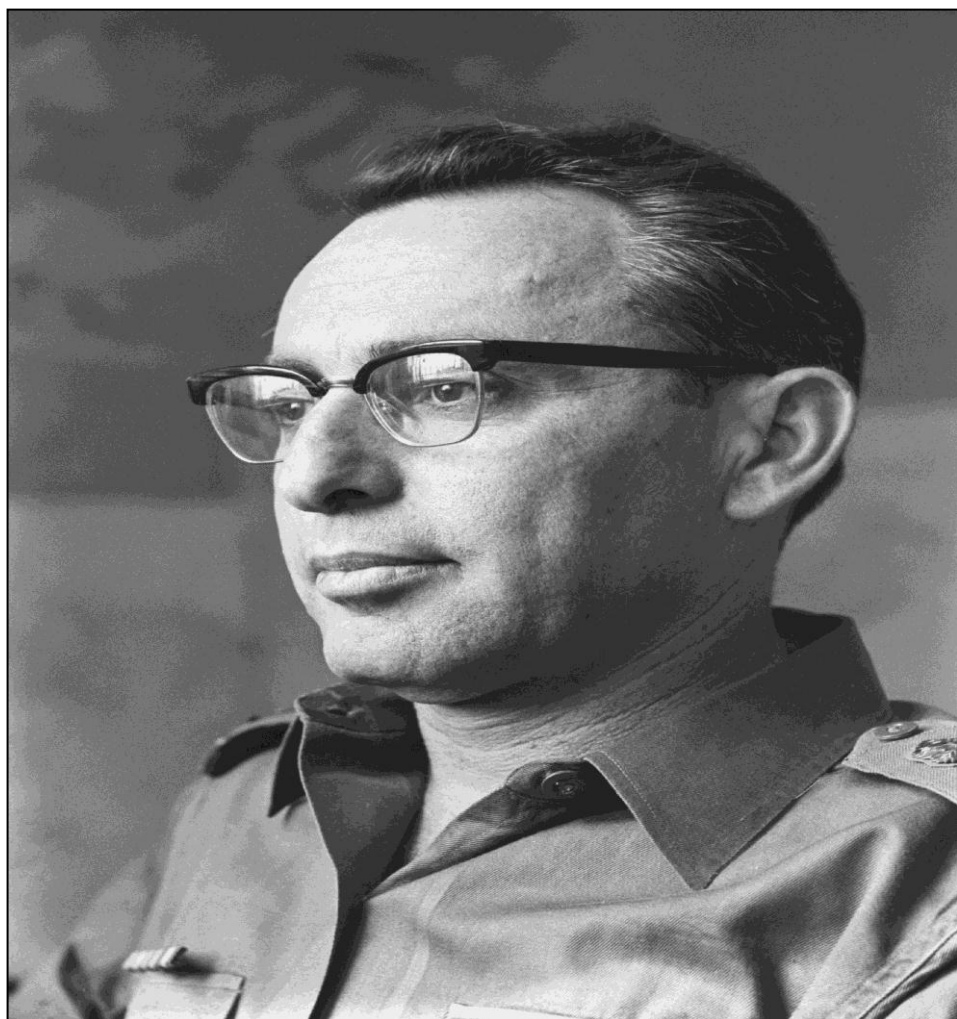
רב-אלוף צבי צור (צ'רה) ראש המטה הכללי השישי של צה"ל