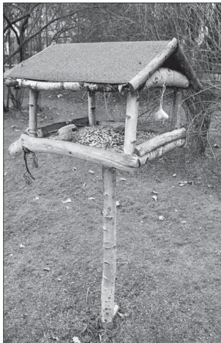
Krmítko na zimu.

Na krmítko by měla být dávana potrava kvalitní a nezkažená. Můžeme použít například ovesné vločky, slunečnici, drcené oříšky, lůj, slaninu, strouhanou housku, strouhanou mrkev, tvaroh, mák, řepku a různé přírodní plody (bobule, šípky, bez černý). Na krmítku by se nikdy neměly objevit těstoviny, slané, kořeněné a uzené výrobky, vepřové sádlo, margarín, neuvažená rýže, chléb ani přepálený lůj.