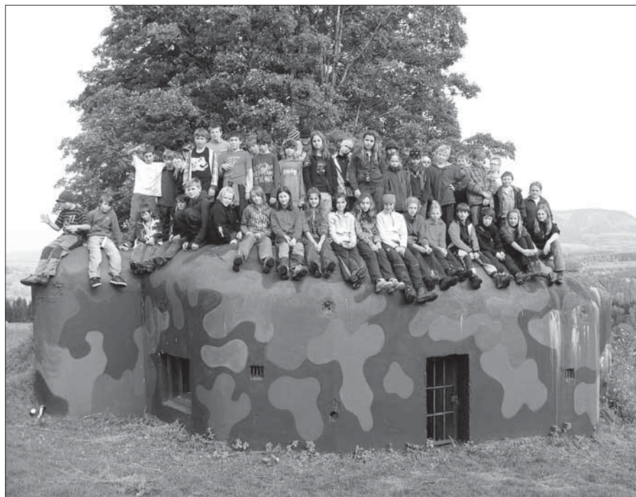
Návštěva pevnosti Stachelberg.

V úterý 19. 9. se do haly v Jablonci sjely školy z Libereckého kraje, aby si zazavodily v atletice. Kinderiáda je závod 2.–5. tříd. Všichni běží 60 m, druháci skáčí