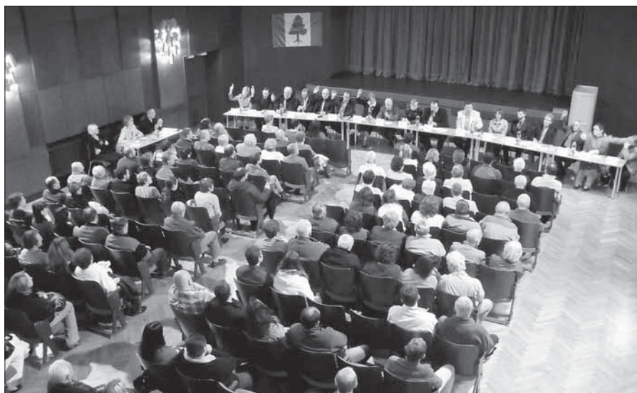
Z ustavujícího zasedání nového zastupitelstva.