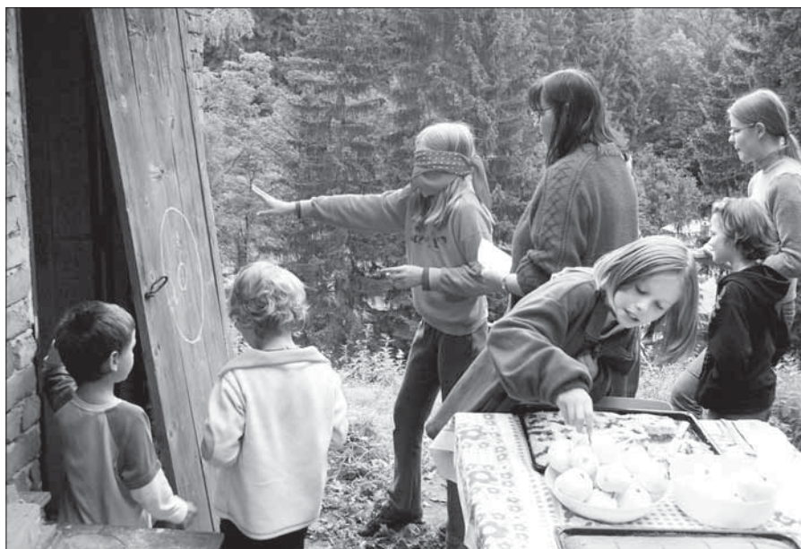
Ze setkání pěstounských rodin.