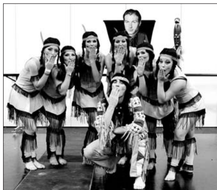
Malá skupina Vinnetou.