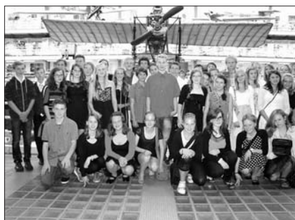
Žáci ZŠ Komenského v Národním technickém muzeu.

Jízdu ZŠ Komenského do Prahy s návštěvou Národního divadla se ve čtvrtek 18. září zúčastnila většina žáků devátých tříd a několik zájemců z osmé třídy. Navštívili jsme nejprve expozice Národního technického muzea, odpoledne byl čas na procházku a nákupy