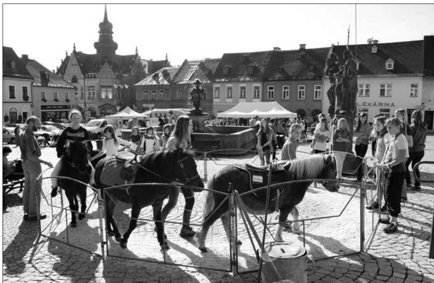
Evropský týden mobility.

Osmý ročník kampaně je úspěšně za námi, a tak můžeme směle vyhlížet ročník další! –kj–