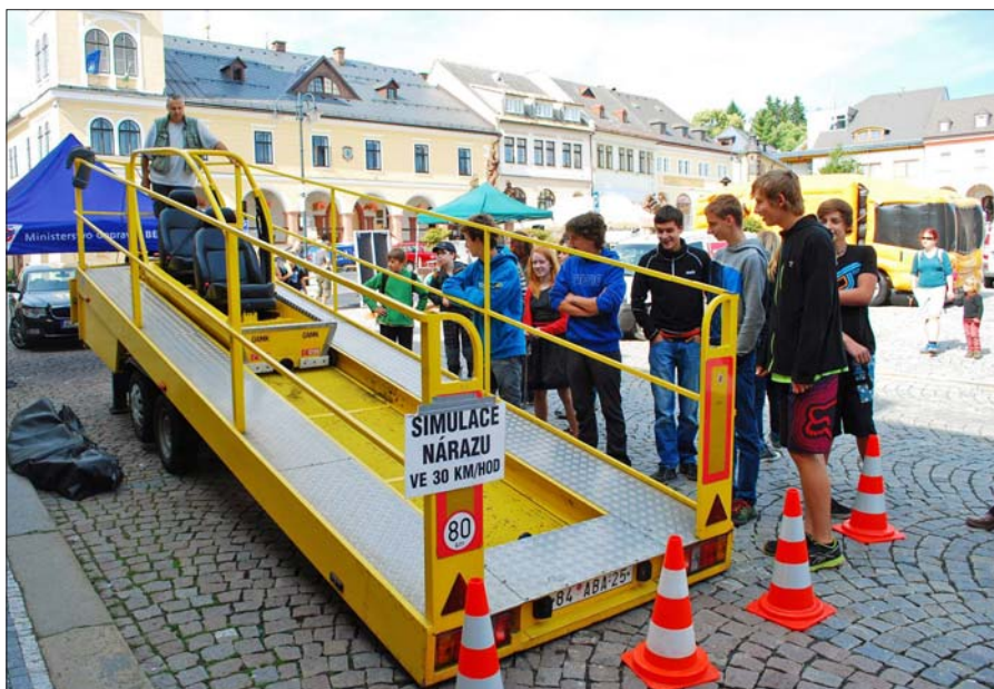
Evropský týden mobility.