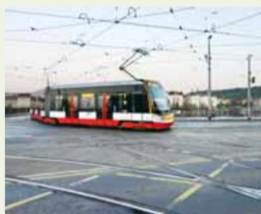
Křížovatka s tzv. tramvajovým „superkřížem“ se nachází na Palackého náměstí

Text: Jan Gross