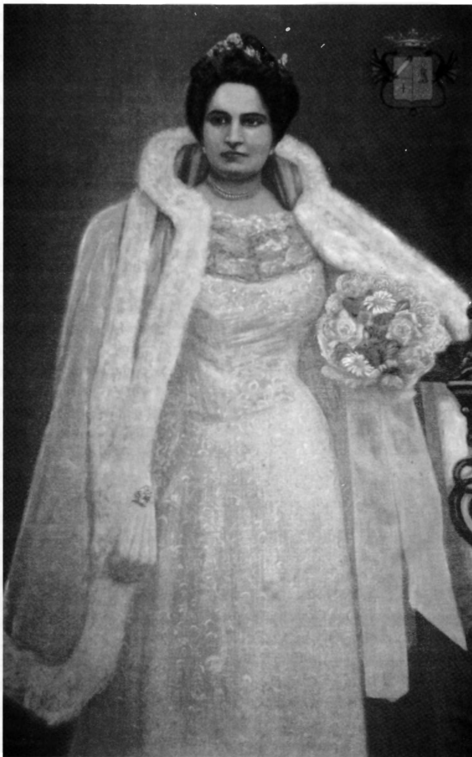
La marquesa de la Villa de San Andrés, reina de los Juegos Florales de La Orotava en 1901. Óleo sobre lienzo.