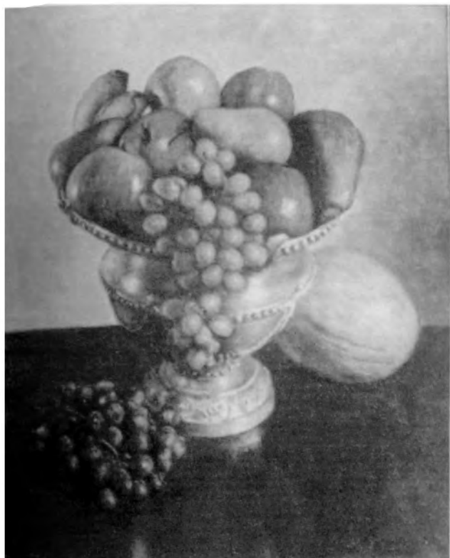
Naturaleza muerta. Óleo 46x56 cm.