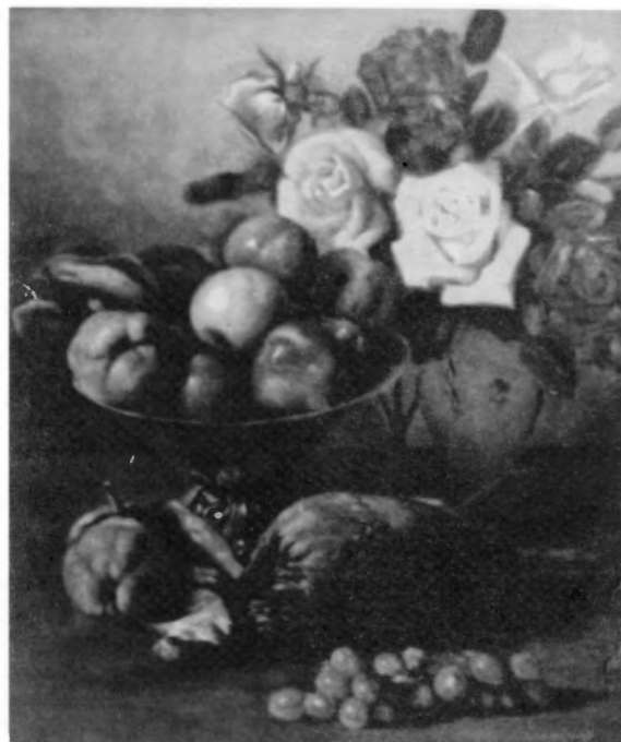
Naturaleza muerta. Óleo 46x56 cm.

Siguiendo las pautas de su hacer, dentro del naturalismo español, en los años setenta retoma un motivo de trabajo de su juventud: los campesinos. Lo que al principio fueron pasiegos, después serán campesinos y roncotes canarios. Lleva el artista al lienzo aspectos triviales de la vida campesina no exentos de nostalgia: haciendo calcetas, cerniendo grano, ordeño... La producción se basa bien en la observación directa o auxiliado de las nuevas técnicas que le permiten terminar la obra en el taller. Su obra no tiene nada que ver con el Indigenismo ni con el Regionalismo que tanto predicamento habían alcanzado en Canarias. Lo que hace Joan Baixas Sigalés son retratos, muy en consonancia con su propia tradición, contextualizados en el Naturalismo.