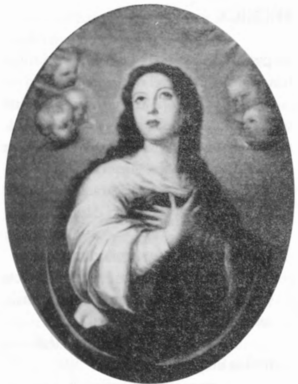
Copia de un original de Murillo. Óleo ovalado, 72x92 cm. 1953.