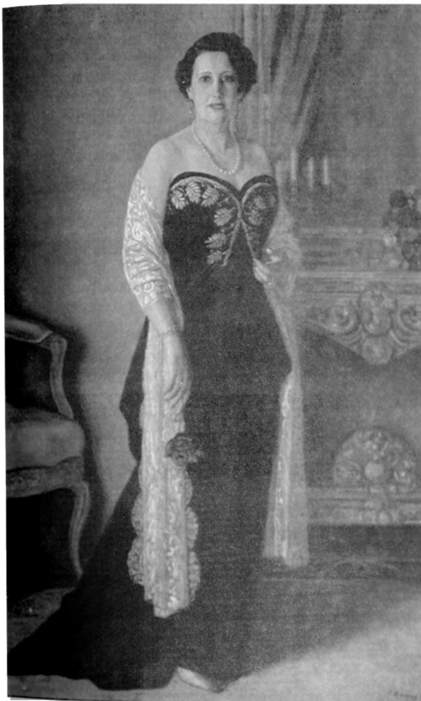
Campión Rodríguez Torres. Óleo sobre lienzo.

posteriores suplía la no organización oficial con la exposición permanente que tenía en su taller de la calle Tenerife - Las Canteras.