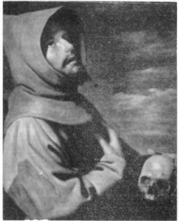
Copia de un Zurbarán. Óleo 50x67 cm. Original en la Pinacoteca Antigua de Munich.

Es en el paisaje donde menos insiste Juan Baixas Sigalés en su etapa más brillante. Aun cuando lo trabajó no fue su tema favorito. La crítica no le es adversa, pero el pintor sabe que no es su interpretación por lo que más le requieren. Si en su primera etapa no fue lo mejor estimado por la crítica, no por ello dejó de alcanzar, en la etapa de Las Canteras y especialmente en formato pequeño, elevada cota. En los pocos que he conocido está presente la misma sobriedad de colores y luces que se presentan en sus otras composiciones, nada de derroche ni de excesos cromáticos, pero sí de retos. Pienso también que no fue la producción más interesante y que se vio condicionado por una demanda poco exigente y presurosa, junto con poca ilusión del autor. No por ello el conjunto de esta temática puede ser poco valorado.