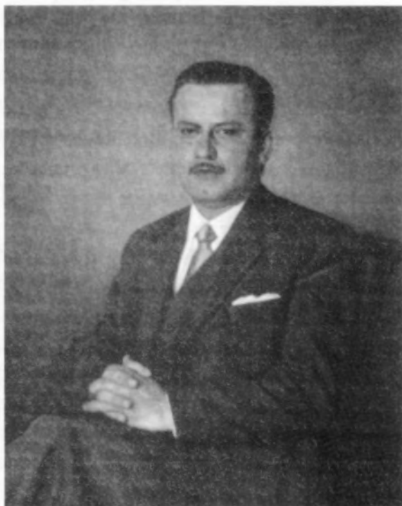
Emilio Luque Moreno. Óleo 81x65. 1955.

Otra nota a tener en cuenta es que el conjunto mayor de su obra está ubicado principalmente en Canarias y Cataluña con piezas, tal vez menos impresionantes, en diversos puntos de Europa Central y Nórdica.