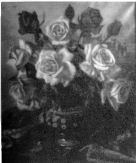
Ramo de Rosas. Óleo 37x45. 1949.