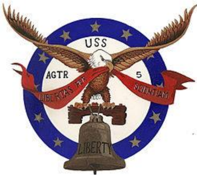
Figure 1 - סמל ה'ליברטי'

בשעות הערב של 7 ביוני (שעות מספר לפני הגעת האונייה לאזור) זימן אליו הקברניט את הקצין הממונה על הנושא, ובדק עמו כיצד תשפיע ההתרחקות מהחוף על ביצוע המשימה. זה השיב כי אנשיו מתכוונים לעבוד בתדרי UHF, דבר המחייב יצירת קשר־עין עם החוף, וכי התרחקות אל מעבר לאופק תפחית את יעילות הביצוע ב-4.80% 4 חוות דעת מקצועית זו הביאה את הקברניט להחלטה להתקרב לחוף, למרות הסכנה, כדי לבצע את משימתו.