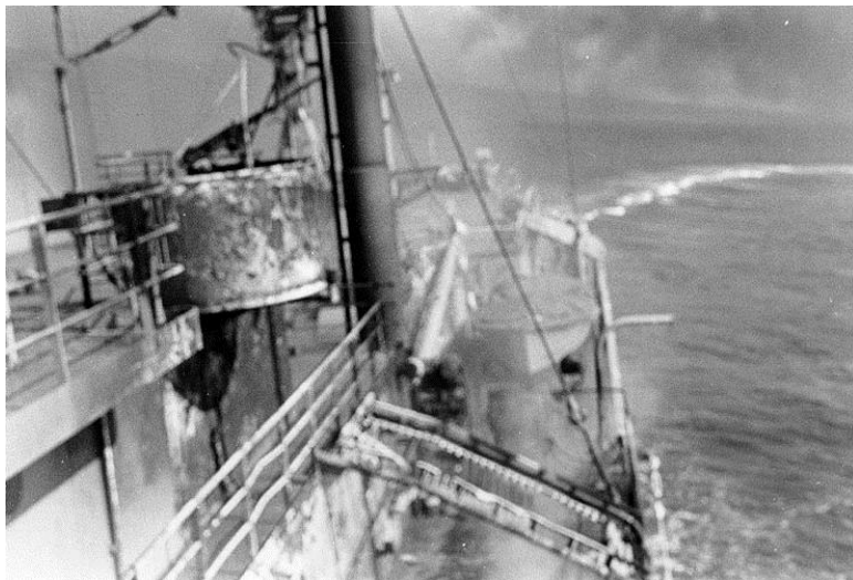
Figure 4 - תמונה שצולמה על-גבי ה'ליברטי' בעת הקרב