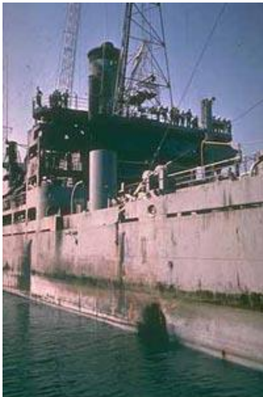
Figure 3 - ה'ליברטי' עם חור פגיעת הטורפדו