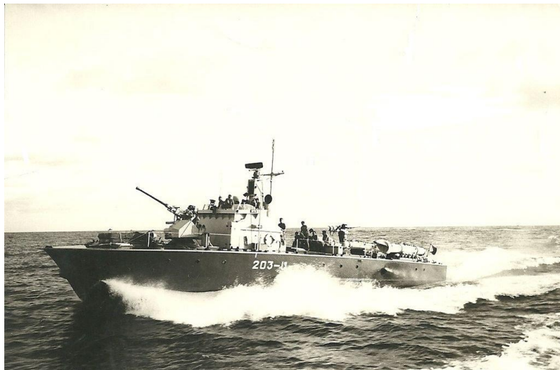
Figure 2 - אחת מטרפדות חיל הים שהשתתפו בתקיפה