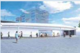
北口完成イメージ図 (平成31(2019)年夏頃完成予定)