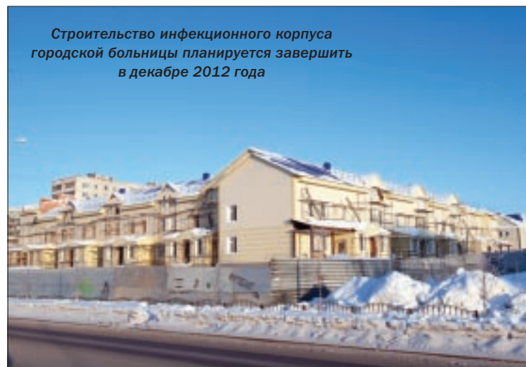
Строительство инфекционного корпуса городской больницы планируется завершить в декабре 2012 года

На совещании также обсуждались вопросы строительства инженерных сетей и ремонта дорог в 2012 году. На ремонт дорог в Мегионе из окружного бюджета вновь, как и в прошлом году, выделяется 48 млн рублей. 30 млн будет потрачено на реконструкцию улицы Губкина, 18 – на ремонт дорог местного значения в Мегионе и пос. Высокий.