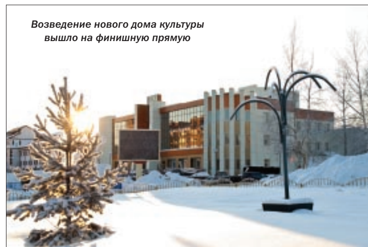
Возведение нового дома культуры вышло на финишную прямую