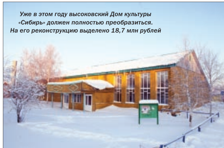
Уже в этом году высоковский Дом культуры «Сибирь» должен полностью преобразиться. На его реконструкцию выделено 18,7 млн рублей