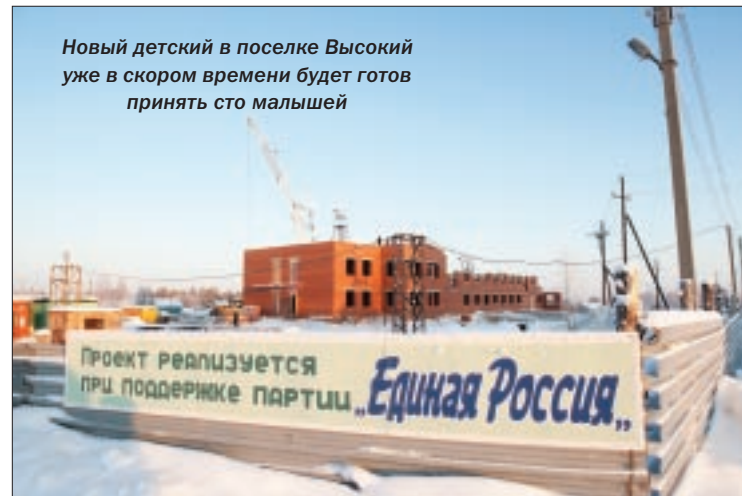
Новый детский в поселке Высокий уже в скором времени будет готов принять сто малышей

По материалам пресс-службы администрации г. Мегиона.