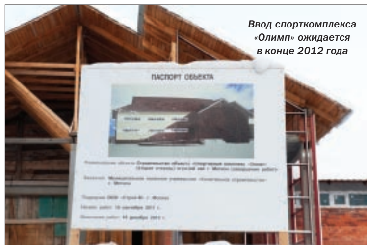
Ввод спорткомплекса «Олимп» ожидается в конце 2012 года