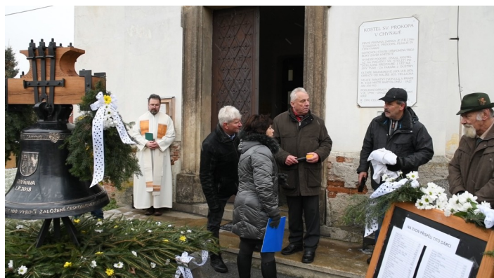
Vzácný okamžik zachytil fotograf Luboš Řežábek – čtyři chyňavští starostové u nového zvonu.