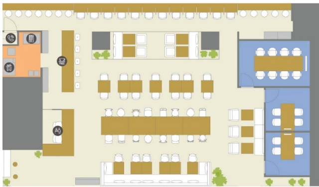
▶12F フロアレイアウトイメージ