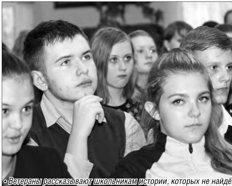
Ветераны рассказывают школьникам истории, которых не найдешь на страницах учебников

В течение пятнадцатидневных боев японская армия потеряла более 880 тысяч человек убитыми, ранеными, пропавшими без вести и пленными. Полный разгром Квантунской армии стал образцом подлинной молниеносной войны, осуществленной Советской Армией. Стратегический замысел операции с использованием мощных фланговых ударов по сходящимся в центре Маньчжурии направлениям в сочетании с вспомогательным ударом на севере полностью себя оправдал. Разгром Квантунской армии и потеря военно-экономической базы в Северо-Восточном Китае и Северной Корее стали решающими фак-