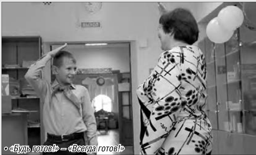
«Будь готов!» – «Всегда готов!»

Сотрудники отделения пропаганды безопасности дорожного движения и отделения ДПС и розыска ГИБДД Магнитогорска навестили воспитанников центра помощи детям, оставшимся без попечения родителей.