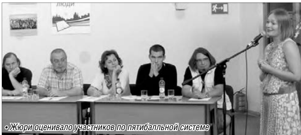
Жюри оценивало участников по пятибалльной системе