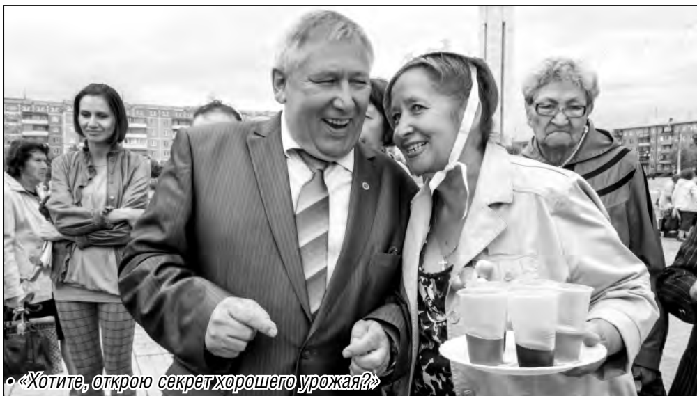
«Хотите, открою секрет хорошего урожая?»

В канун выходных состоялась традиционная выставка «Дары осени»