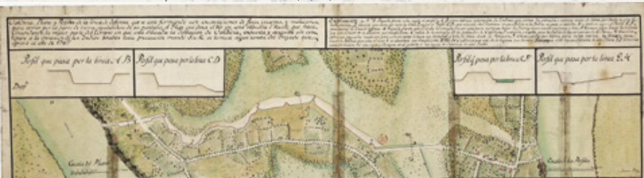
Antonio Duce: Plano y Perfiles de la Muralla de Valdivia, c. 1780 (BNCh).