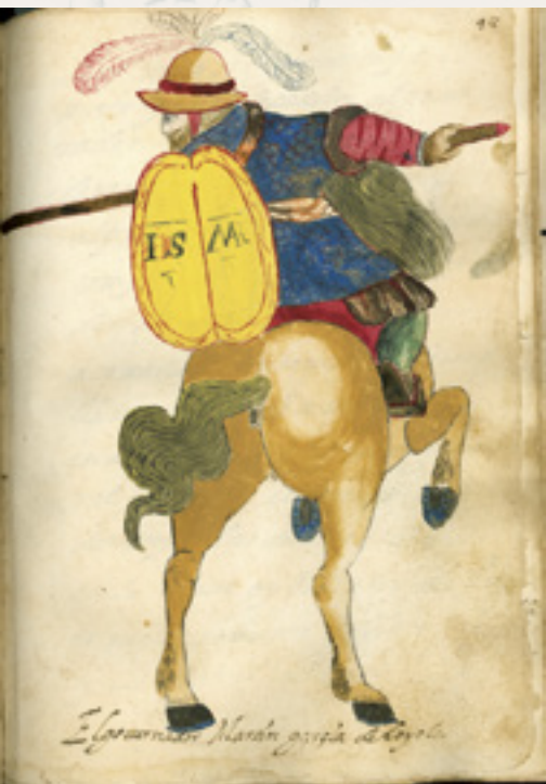
El Nuevo Mundo, 1599-1605 (Biblioteca de la Universidad de Oviedo, España).

EN FEBRERO DE 1645 Antonio Sebastián de Toledo, segundo Marqués de Mancera, entró al estuario con una flota pertrechada para varios años. En su escaso mes de permanencia dejó diseñado un sistema interconectado de fortificaciones que cerrarían la puerta a la ambición de sus enemigos. En los siguientes dos años se colocarían los fundamentos de cuatro castillos: San Pedro de Alcántara , primer asiento de la repoblación, en una isla que llamaron de Mancera, situada al fondo de la bahía; San Sebastián de la Cruz en Corral; San Luis de Alba de Amargos, en la ribera sur; y el de la Pura y Limpia Concepción de Monforte de Lemos en la ribera norte, en Niebla. Pensados como partes de un mismo sistema de defensa, sus fuegos cruzados imposibilitaron definitivamente el acceso de naves enemigas al río y a la Plaza, Puerto y Presidio de Valdivia.