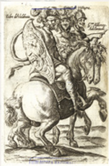
Conquistadores. Historia Relación del Reyno de Chile, Alonso Ovalle, 1646.