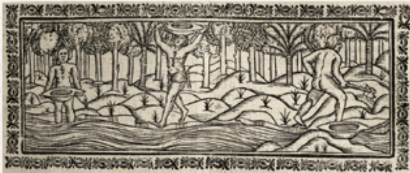
Lavaderos de Oro. Historia General y Natural de las Indias , Gonzalo Fernández de Oviedo, 1535 (Biblioteca Nacional de Chile / BNCh).