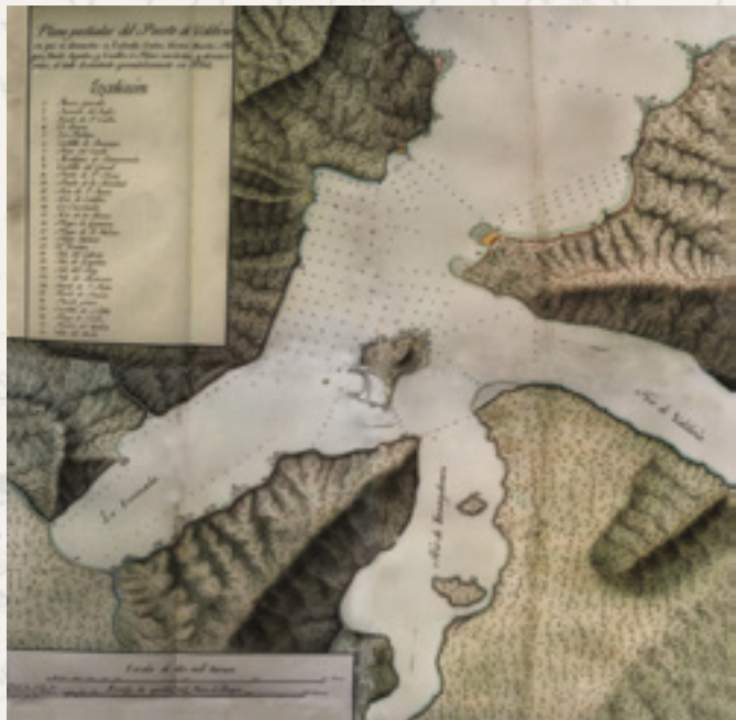
Juan Garland y White: Plano del Puerto de Valdivia, 1764 (BNCh).