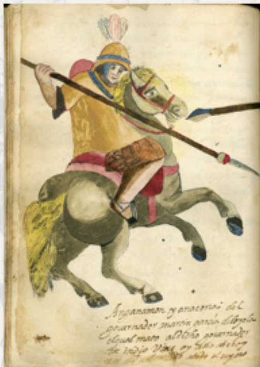
Anganamón y García de Loyola. Relación del Viaje de Fray Diego de Ocaña

Pero esta vez fueron escuchadas las voces que desde hacía décadas alertaban a la Monarquía Católica sobre el peligro de perder tan ventajoso puerto.