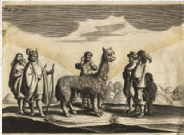
Ilustración del Diario y Relación ... de Hendrick Brouwer, 1643 (BNCh).

EN EL INICIO LOS CASTILLOS eran solo baterías que aprovechaban las ventajas del lugar, con barracones para la tropa y almacenes de pertrechos; no alcanzarían un primer estado de consolidación sino hasta fines del siglo XVII. Los gobernadores e ingenieros pasarían proyectos y más proyectos de ampliación, entre solicitudes de aumento de la dotación militar y estrategias para traer más presidiarios a las obras. Pero la primera mitad del siglo XVIII transcurriría casi sin cambios. Sólo el de Niebla verá concluida, alrededor de 1714, una obra fundamental: su batería de dos niveles para alojar 14 cañones, tallada directamente en el promontorio sobre el que se funda el Castillo, a 40 metros sobre el mar y al borde del acantilado.