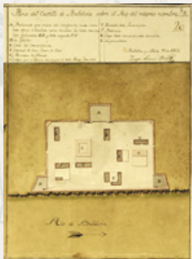
Joseph Antonio Birri: Plano de Valdivia, 1763 (Biblioteca de Cataluña, España).

El resto del siglo y otro más pasarían entre anuncios de piratas o corsarios que nunca se atrevieron a entrar al puerto, y no anunciados e infrecuentes movimientos mapuche. Estos, por otro lado, consentían una relativamente pacífica coexistencia y colaboración, sin las cuales el maltrecho poblamiento no hubiese persistido. Aunque el barco que transportaba el Real Situado (si no se hundía en su viaje anual entre el Callao y Valdivia) aseguraba raciones básicas de alimentos, vestimentas y algún dinero que mantenía activo el comercio. El mar y la tierra proveían el resto: «la abundancia de maíz ... y las papas o criadillas de tierra, que sirven de pan y alimento común de estos naturales y patricios» , dirá el cronista Martínez de Bernabé.