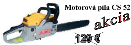
Motorová píla CS 52