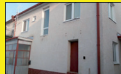
RD - BN, 5 izbový, s letnou kuchyňou a garážou, tichá ulica, pozemok 715 m 2 , € 102.800, tel. 0910299026