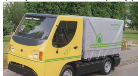
MICROEKO vo valníkovej úprave malo slúžiť aj pre zásobovanie drobným podnikateľom.

V Bánovciach n. B. sa vyrobilo niekoľko kusov týchto elektromobilov, ale s meniacou sa politickou i hospodárskou situáciou sa dobre rozbehnutý projekt zastavil a časom akoby padol do zabudnutia. Trend elektromobilov však práve v tomto období má vo svete zelenú a mňa teší, že bratislavskí vysokoškooláci vyvinuli prvú slovenskú elektroformulu, pričom popri