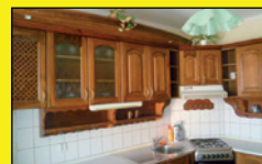
4i - BN, Dubníčka, plastové okná, plávajúce podlahy, balkón, pivnica, ihneď voľný, 84 m 2 , € 47.500, tel. 0907369379