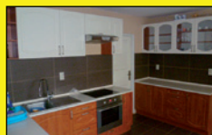
RD - Dvorec, 3 izbový, s príslušenstvom, po rekonštrukcii, veľký pozemok 1293 m 2 , € 71.000, tel. 0907369379

Hľadám pre klientov: 2i byt, plastové okná, murované jadro / 3i byt, do € 40.000 / 1i - 2i byt na nájom do € 300