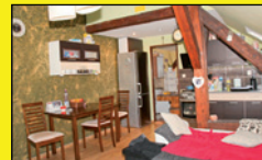
2,5i - Žabokreky n/Nitrou, moderný mezonet so zariadením a parkovacím miestom, 70 m 2 , € 37.000, tel. 0904024073