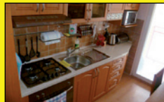
3i - BN, Dubníčka, nová linka so zabudovateľnými spotrebičmi, komplet rekonštrukcia, 63 m 2 , € 51.500, tel. 0907369379