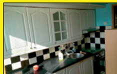
3i - Šišov, plastové okná, nová kuchynská linka, plávajúce podlahy, dve pivnice, 57,8 m 2 , € 33.500, tel. 0904024073