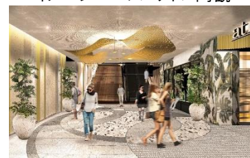
イメージパース アトレ内観