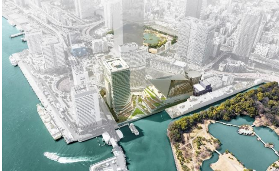
イメージパース(浜離宮恩賜庭園側外観)