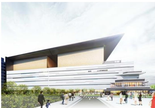
(イメージパース)シアター棟外観