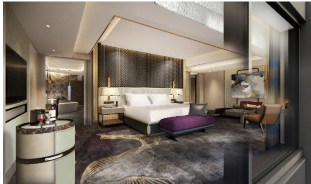
イメージパース(スイートルーム)