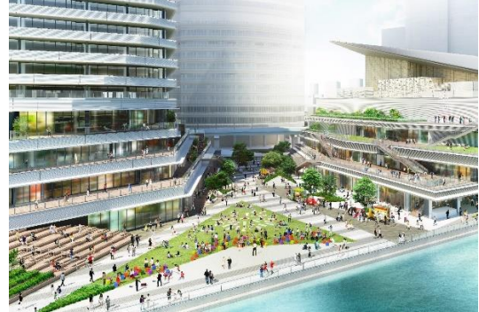
イメージパース(広場・テラス・水辺)