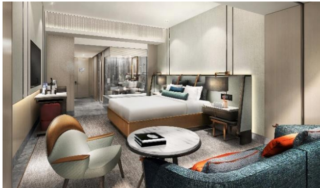
イメージパース(スタンダードルーム)

タワー棟の上層階に位置する「メズム東京」は、JR 東日本グループである日本ホテル(株)とマリオット・インターナショナルが初提携したラグジュアリーホテルです。グローバルレベルのサービスでお客様の五感を魅了し、世界中からのお客様をお迎えします。このたび、2020年4月27日(月)の開業決定を記念して、ダイニングクレジット付き開業記念宿泊プランを販売します。