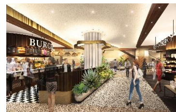
イメージパース アトレ内観

アート・ファッション・カルチャーに焦点をあてたラグジュアリーナイトクラブラウンジや五感を研ぎ澄ませ、自らの感性を高めることができる日本初のソーシャルエンターテインメント施設、水辺を臨む開放的なテラスで食事を楽しめる飲食店などが入居を予定しています。