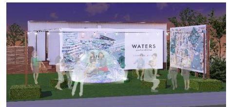
イベントイメージ

開催予定日 2019年9月12日(木)～9月15日(日) 開催時間 15時～23時 場所 The Farm Tokyo 内イベントスペース (東京都中央区八重洲2丁目1-1)