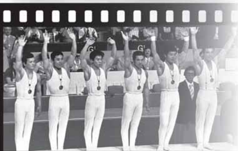
モントリオール五輪で団体の五輪5連覇に貢献

今回の特別展では、出場したオリンピック3大会で金メダル8個を獲得した五泉市出身の元体操選手加藤澤男氏が、オリンピックで着用した日本選手団制服や、家族が大切に保管していた当時の新聞記事の切り抜きなどを展示します。