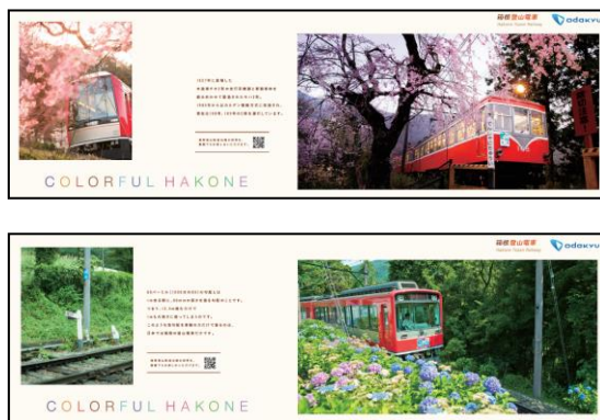
車内の中吊りポスター