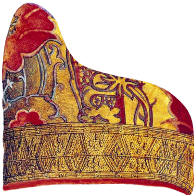
Il corno dogale o berretto del Doge.

Festa della Madonna della Salute e Presentazione della Beatissima Vergine Maria al Tempio