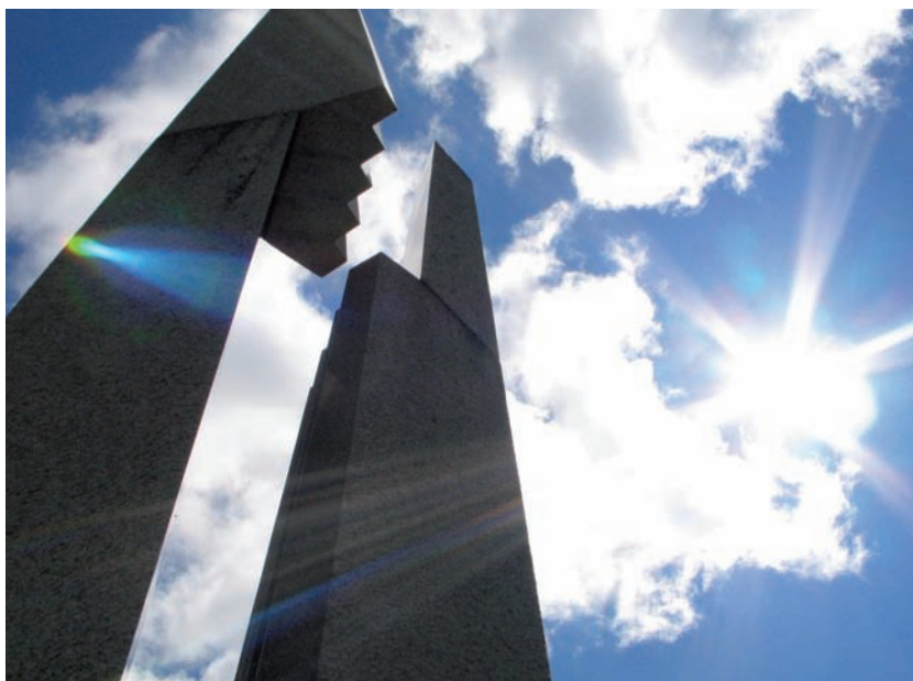
Mezi Slivcí a Milínem byl na věčnou připomínku posledních okamžiků války v Evropě odhalen památník v podobě žulových obelisků vysokých 10,5 a 11 metrů