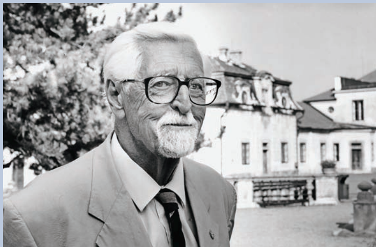
... a ve starším věku