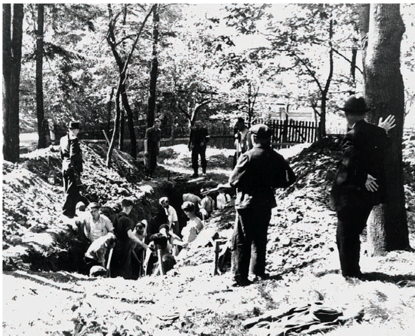
Dopadení němečtí zajatci kopou krátce po skončení bojů před hlavními členy místní revoluční gardy společný hrob na příbramském hřbitově