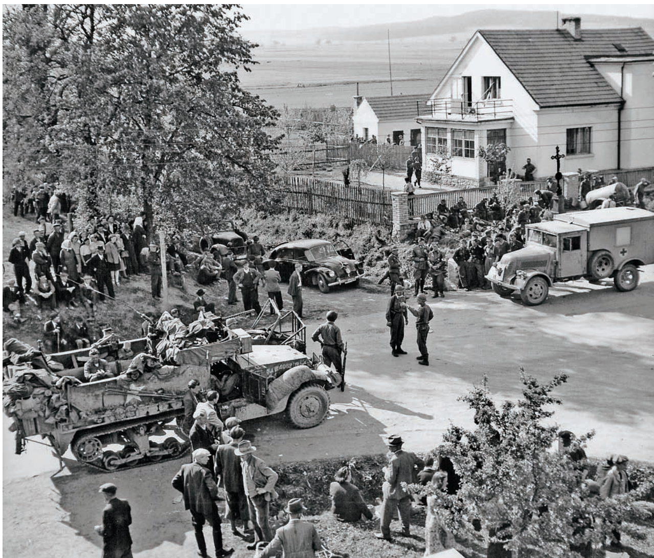
Čimelice, místo tzv. demarkační čáry