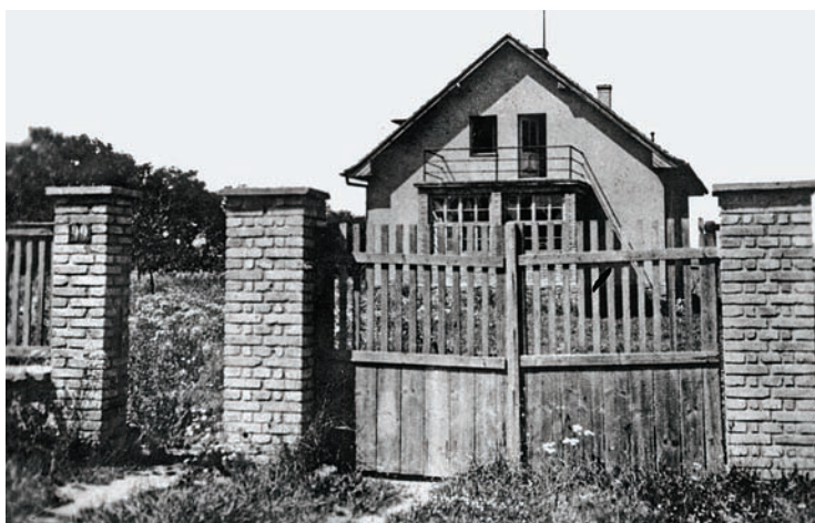
Domek čp. 99, katastr Rakovice, kde se zastřelil generál Pückler