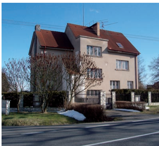
Dům rodiny Peškových. Od května do října 1945 zde měli Rusové kancelář.