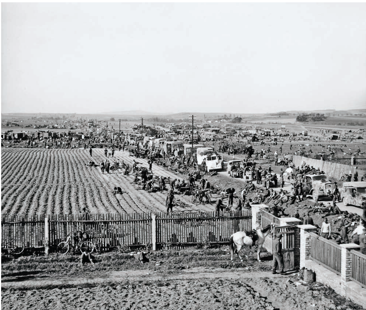
Čimelice, 10. 5. 1945. Desetitisíce německých vojáků na strakonické silnici očekávají výsledky jednání.

vozidlo. Snad proto, že česká osádka byla ozbrojena, byli Němci zastaveni a na mezi u pole Nosků zastřeleni.