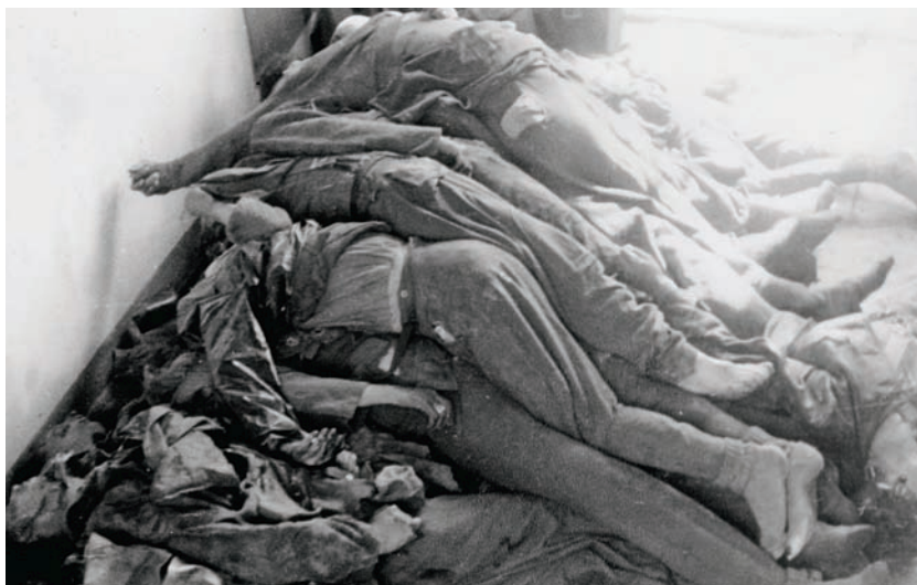
Těla mrtvých příslušníků SS v Březnici