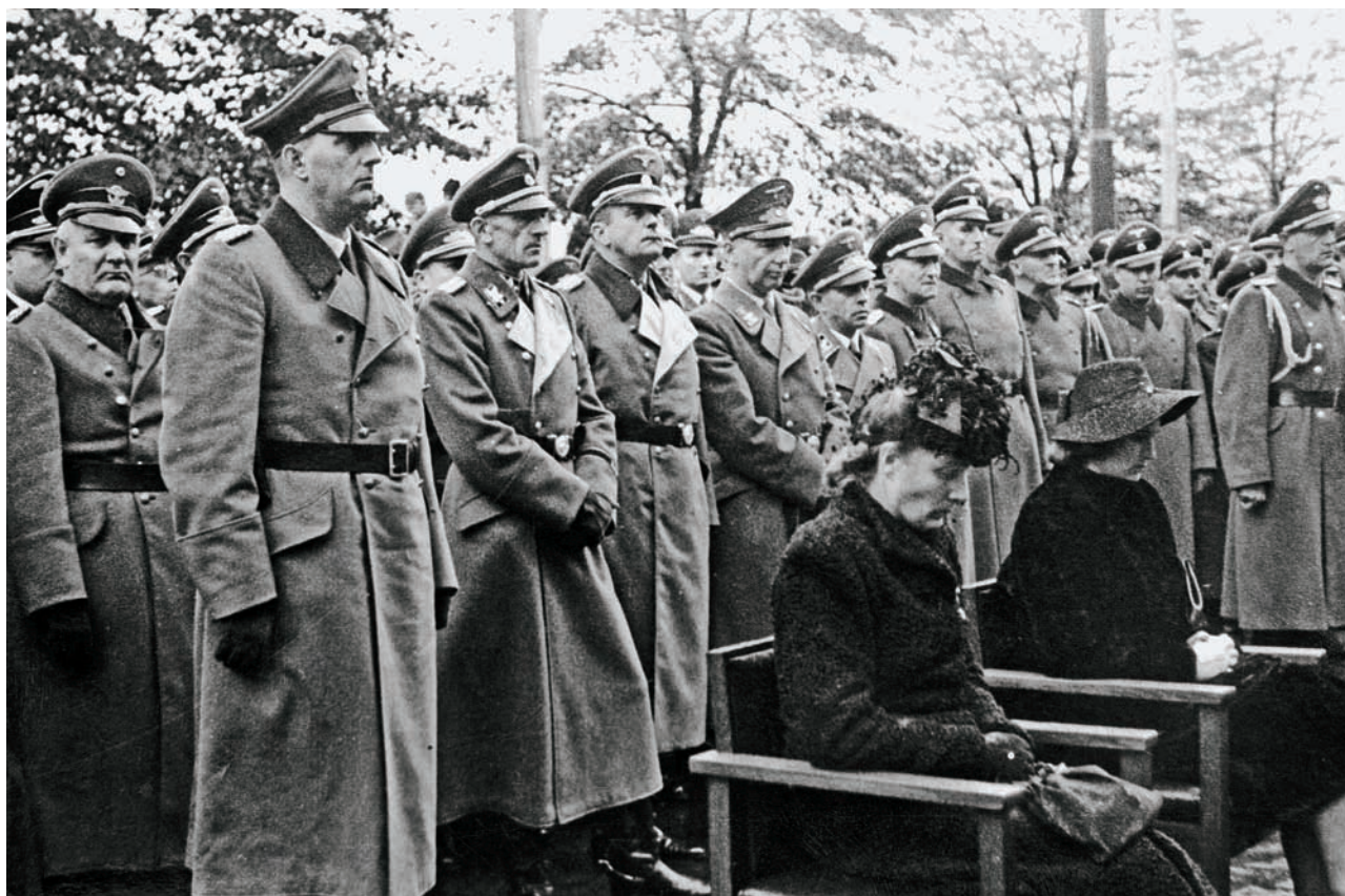
Praha, 18. 10. 1942. Vltavské (nyní Smetanovo) nábřeží bylo přejmenováno na Reinhard Heydrich-Ufer. Zcela vlevo velitel pořádkové policie generál Paul Riege, před ním úřadem zastupujícího říšského protektora pověřený Kurt Dalugee, státní tajemník K. H. Frank a generál Pückler. Sedící zleva: vdova Lina Heydrichová a Frankova manželka Carola.

Z českého obyvatelstva nebyl nikdo ani zabit, ani zraněn. Škody na budovách byly minimální. Od toho okamžiku ale žili občané Čimelic ve stálém napětí. 3