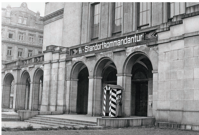
Právnická fakulta UK – za Protektorátu Čechy a Morava sídlo posádkového velitelství SS, sídlo velitele Waffen-SS generála Pücklera

Do Prahy dorazila 1. divize Ruské osvobozené armády (ROA). Odpovědně se jednotky 2. pluku ROA zapojily do bojů proti Němcům. Z bojové skupiny „Wallenstein“ (Kampfgruppe Wallenstein), dislokované v prostoru