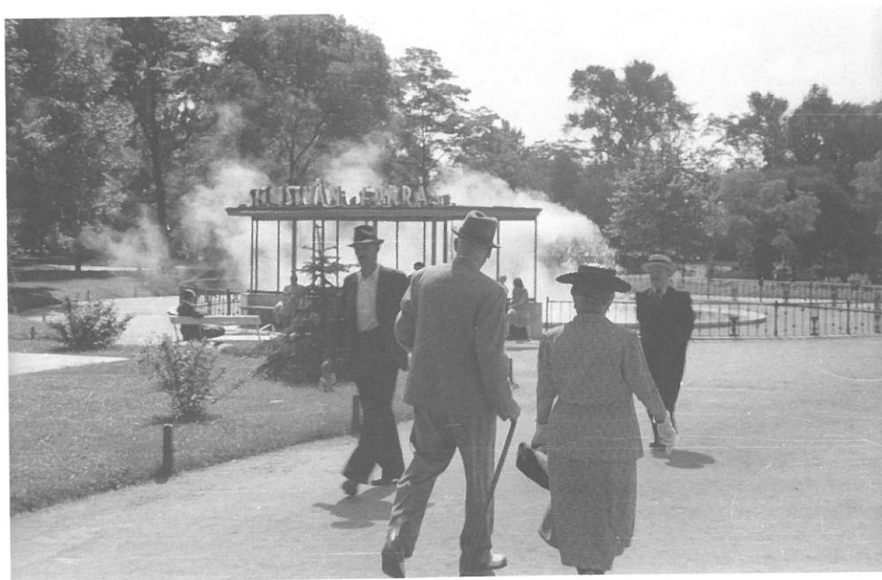
A Széchenyi gyógyfürdő melletti ivókút (más néven Szent István forrás) 1937-ben