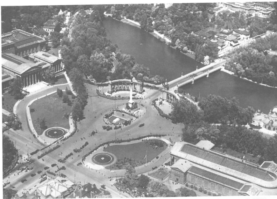
Légifotó a Hősök teréről, a Városligeti-tó környékéről és a Városliget bejáratáról, 1935