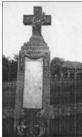
Monumentul eroilor, 10 iulie 1937 (M.C.)