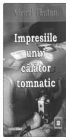
Viorel Tătaru Impresiile unui călător tomnatic Colecția Scriitori Sălăjeni