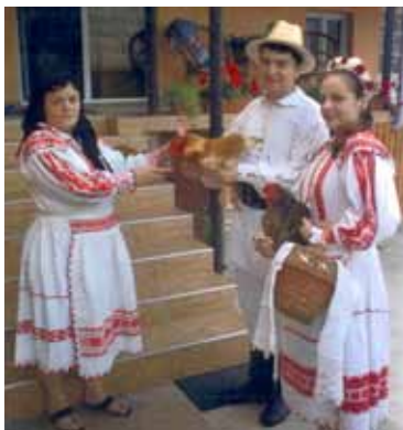
„Avem ce-duce la nuntă / Dă trii zâle nu să ciuntă”

14. Zi hididiș dă-nvârtit Că pământu-i bătucit Și joc și io cu bade Și cu noi tătă lume.