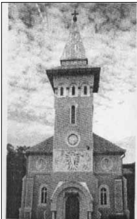
Biserica „Sfinții Apostoli Petru și Pavel” Pria, 1930-1937