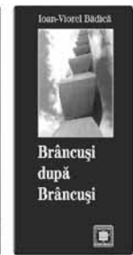
Ioan Viorel Bădăci Brâncuși după Brâncuși Colecția Scriitori Sălăjeni

Comenzi la Centrul de Cultură și Artă al județului Sălaj