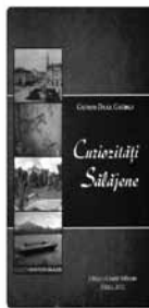
Gostila Cuvinte din Gostila Colecția Scriitori Sălăjeni