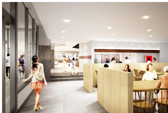
3Fウェルカムテーブル