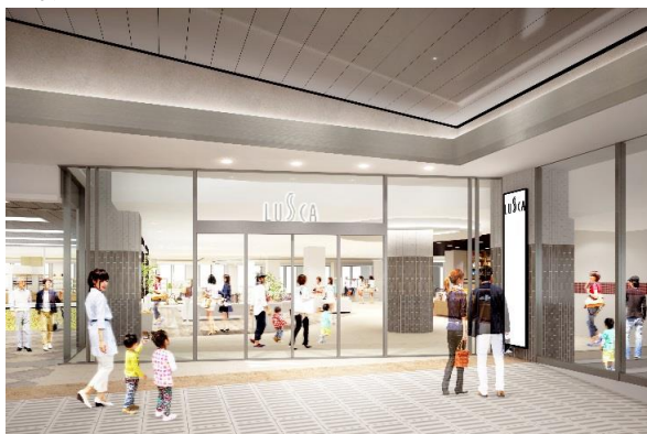
3F入口リニューアル後