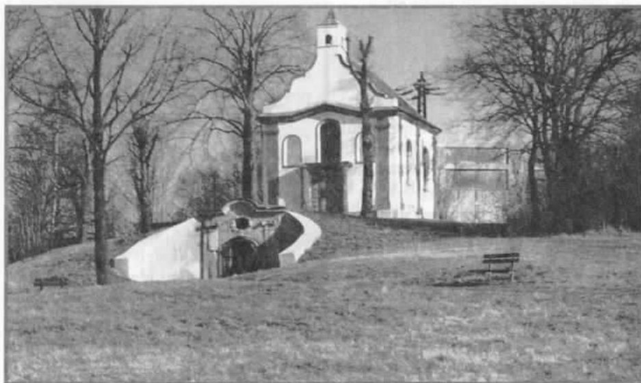
Kostelík sv. Jana Křitele s grottou po rekonstrukci v roce 1998