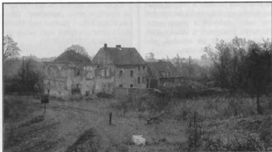
Zalužany 1964 – pohled z původní hlavní silnice Zalužany –Modlany