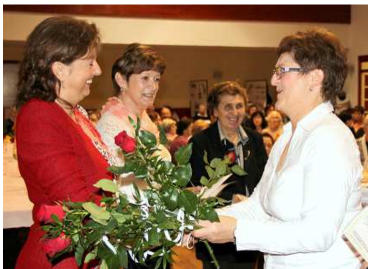
Předání cen vítěžkám soutěže Rozkvetlá okna a upravená předzahrádka.