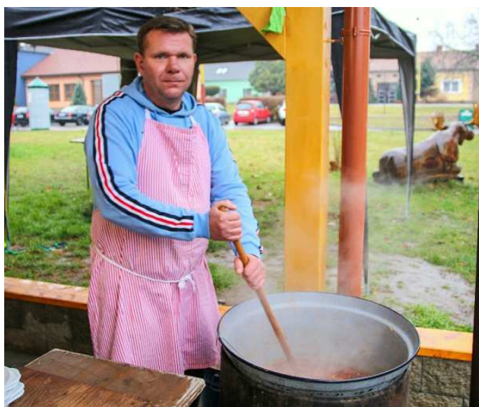
O nejlepší zelňačku – 1. místo