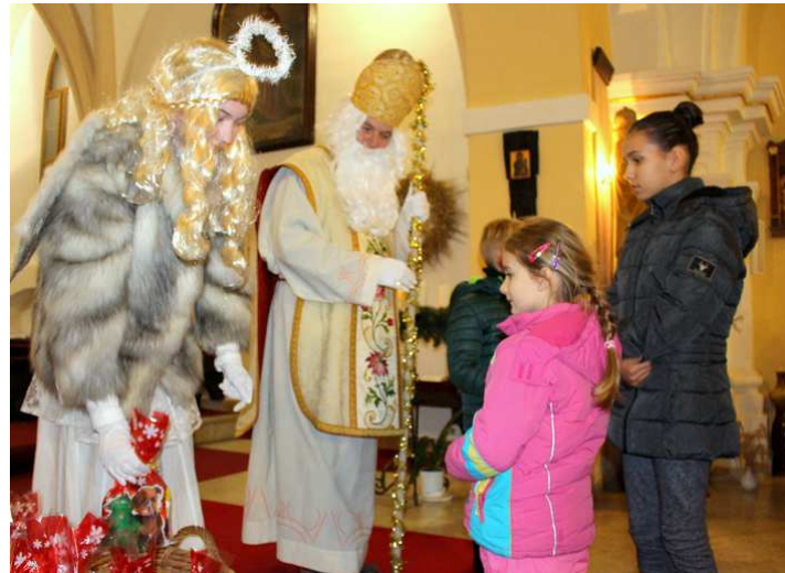
Sv. Mikuláš v kostele