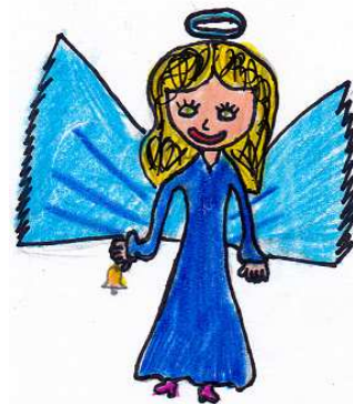
kresba: A. Koutná

Ve čtvrtek 1. prosince ve škole proběhla Vánoční dílnička. Na úvod nám zazpívaly a zahrály děti z hudebního kurzu. V jednotlivých dílnách si návštěvníci vyráběli krásné vánoční výrobky a možná si odnesli i vánoční dárečky pro ty nejmilejší. Po pilném malování, lepení, stříhání a přebíhání z dílničky do dílničky, si všichni mohli odpočinout a posílit se ve vánoční kavárničce, kterou otevřeli žáci sedmé třídy ve školní kuchyňce. Všichni si zaslouží náš obdiv za výrobu kreativních a velmi chutných palačinek, ke kterým podávali ovocný vánoční nealkoholický punč.