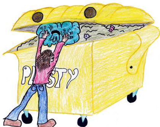
kresba: E. Chovancová

Sběrné středisko odpadů v Mikulčicích bude otevřeno naposledy v tomto roce ve středu 21. 12. 2016 a potom v pondělí 2. 1. 2017. Mezi uvedenými dny bude sběrný dvůr uzavřen.