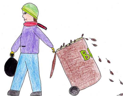
kresba: S. Březinová

V pátek 14. října proběhl již 5. ročník celorepublikové akce 72 hodin – „Uklidme si Mikulčice“. Letos s heslem Pomáhám, protože chci. Hrabali jsme listí v parku u školy, připravovali zahradu na zimu a uklízeli školní sportoviště. Pro všechny občany opět připravujeme Eko kalendář.