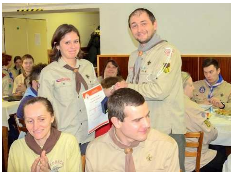
Volební okresní setkání skautů v Mikulčicích