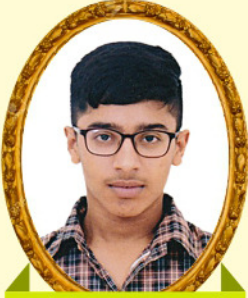
યશ હિલીપભાઈ બાવડા-રાજકોટ 89.48 PR / 72.33%