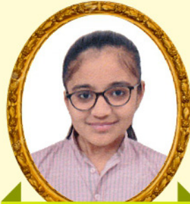
કૃપાલીના ભકિતદાન બોશા-રાજકોટ 98.24 PR / 86.16%