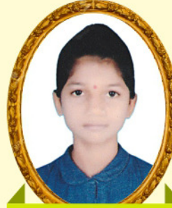
જાહલ હસુભા ઘાંઘણીયા-નાનાવડા 87.73 PR / 70.66%