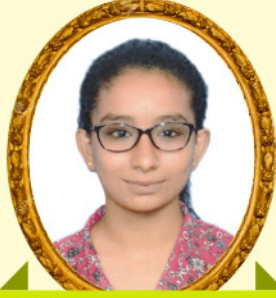
ઘુવી જશકરણદાન ગઢવી-રાજકોટ 99.75 PR / 92.66%