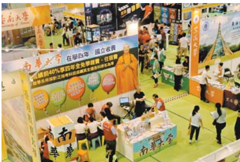
←2020 年大學校院博覽會將於 25、26 日登場。

外國名校跨海搶精英 預料私校將祭出高額獎學金攻勢，搶招全國前 3% 學生；佛光、南華則強調 4 年學費比照國立大學。海外則有新加坡管理學院、諾丁漢大學、香港城市大學、德國 FHM 密特丹科技大學、瑞士飯店管理 & 歐洲精品學院、英國 University of Warwick，都跨海來搶招精英。