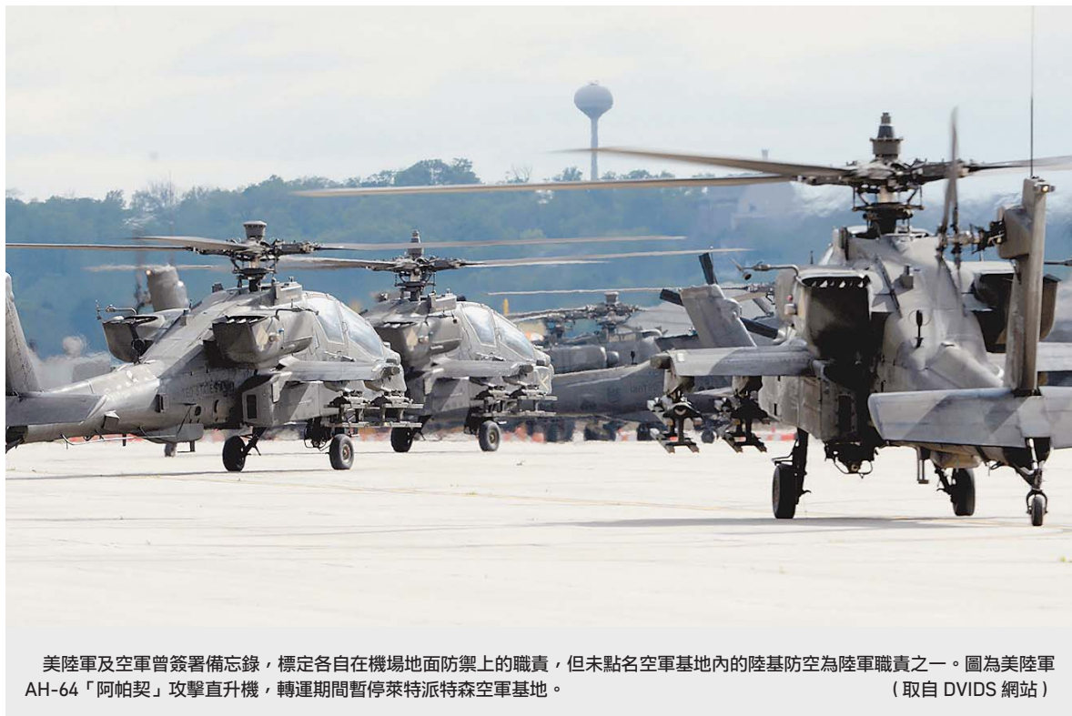
美陸軍及空軍曾簽署備忘錄，標定各自在機場地面防禦上的職責，但未點名空軍基地內的陸基防空為陸軍職責之一。圖為美陸軍 AH-64「阿帕契」攻擊直升機，轉運期間暫停萊特派特森空軍基地。

對美空軍領導班子人而言，最直接的選項就是在職掌中尋求可用手段。在某種程度上，該軍種已這麼做了，這些措施，包括提升土木工程人員跑道維修能力，俾利更有效地因應各式投射攻擊手段的威脅，就可部署之防護機堡發展各式構想，並且於歐洲及亞洲實作疏散執行構想。然這些計畫的規模及進度皆過