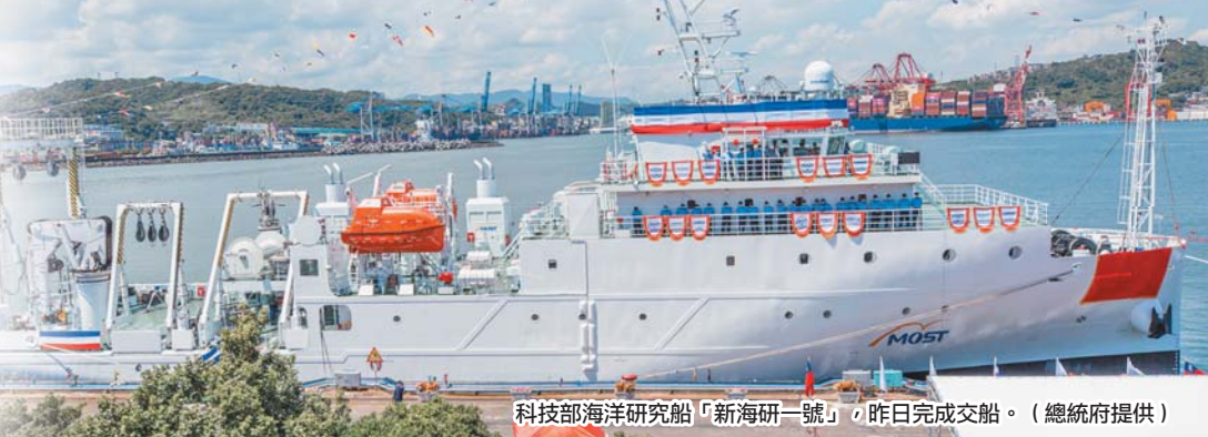
科技部海洋研究船「新海研一號」，昨日完成交船。