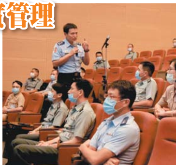
李副總長長期勉在座人員，運用組織的方法落實領導，促進團隊和諧，提升工作效率。

李副總長表示，在座人員未來都將成為國軍中、高階幹部，必須了解管理、領導與執行任務的關係，落實按權責分層管理；「魔鬼藏在細節裡」，任何核心流程，均包括執行人員擬定策略及督導檢查，優秀的管理者應具備結構性思維、敏感的觀察力及制定策略與督導的能力。李副總長特別提醒，每位戰院畢業同學，未來將分發至各部隊擔任領導及管理職務，期許一切從細微處出發，並從法規、制度面，精實訓練與安全管理，確維部隊戰力及人員安全。