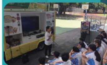
反毒教育行動車入校宣導