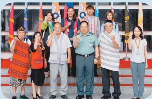
徐執行官與社團法人臺灣泰雅族語言文化研究發展學會一行，於國防部大廳合影。