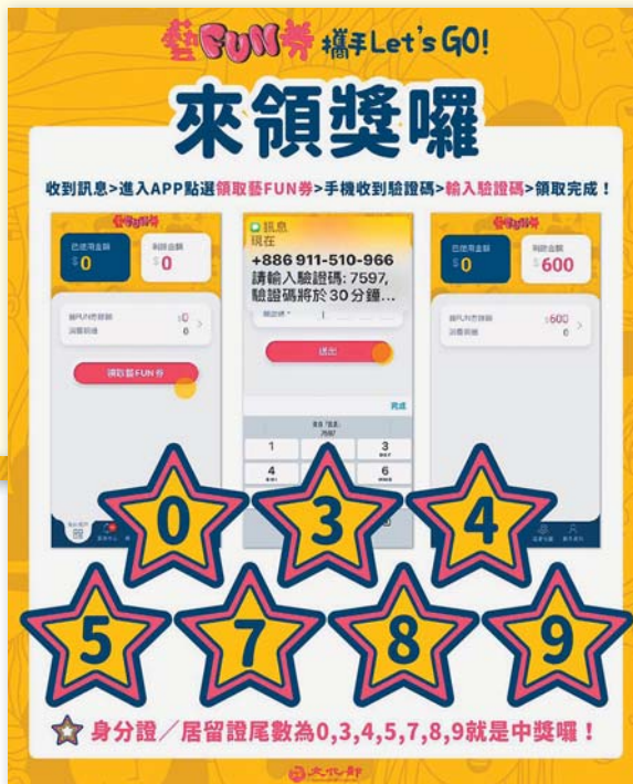
↑文化部「藝 FUN 券」抽中者，包括「0、3、4、5、7、8、9」7 組身分證字號尾數者，總計 210 萬 7883 人可獲獎。（文化部提供）

文化部表示，第 2 梯次「藝 FUN 券」將針對 65 歲以上、18 歲以下的手機弱勢及身心障礙者，規劃與 4 大超商合作專案，比照口罩模式，民衆只要把健保卡插到機台，即可下載「藝 FUN 券」，但仍有份數限制。第 2 波時程後續再公布，希望未抽中的民衆，持續支持藝文產業。