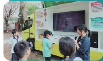
反毒教育行動車入校宣導