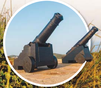
▲大砲連曾是軍事重地，順著海岸線綿延數百公尺的營區，建有碉堡、榴砲等，如今成為馬祖軍事景點。