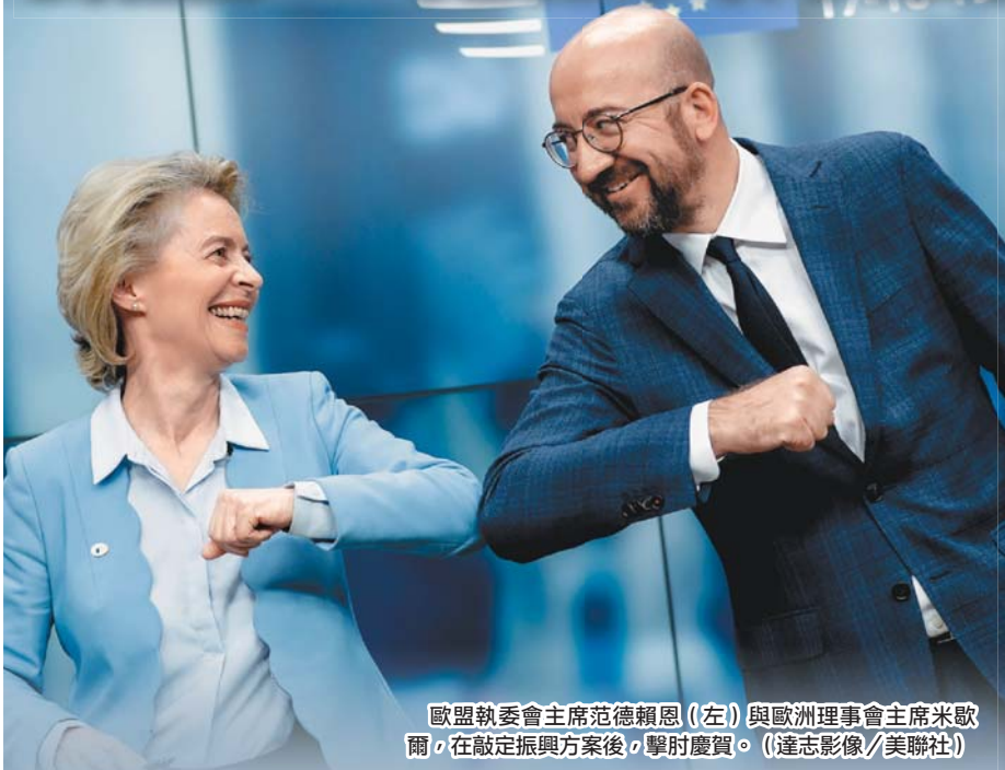
歐盟執委會主席范德賴恩(左)與歐洲理事會主席米歇爾,在敲定振興方案後,擊肘慶賀。