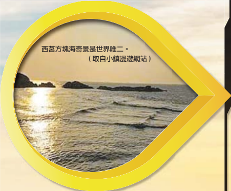
西莒方塊海奇景是世界唯二。

DAY3: 東莒猛澳碼頭—南竿福澳港—山隴獅子市場—馬祖酒廠—八八坑道—牛角一枕戈待旦—馬祖民俗文物館—北海坑道（含大澳據點）—鐵堡—雲台山—津沙聚落—馬港天后宮—南竿機場—鼠歸