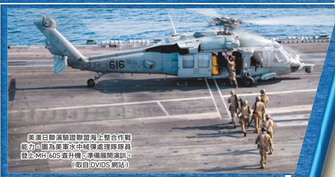
美澳日聯演驗證聯盟海上整合作戰能力。圖為美軍水中核彈處理隊員登上MH-60S直升機，準備展開演訓。

澳洲特遣隊指揮官哈利斯准將表示，美澳日聯合演習提供澳軍極為珍貴的機會，有效提升美澳日的作業互通性，進而強化區域安全，加深合作關係。