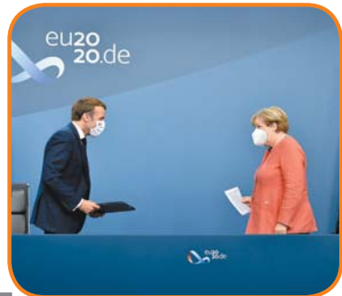
歐盟領袖21日敲定史上最大規模振興方案,被視為梅克爾(右)與馬克宏的重大勝利。

除了「歐洲振興基金」,歐盟也通過未來7年、總額1.1兆歐元(約新臺幣37兆元)預算,將用於會員國農業、移民政策與數百項例行開銷。