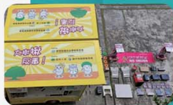
反毒教育行動車開箱文