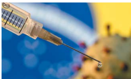
牛津大學研發的新冠疫苗,初步人體實驗成功。

此前,俄國已宣布展開新冠病毒疫苗的臨床試驗,並獲正面反應,以色列也聲稱已找到能夠中和冠狀病毒的抗體。