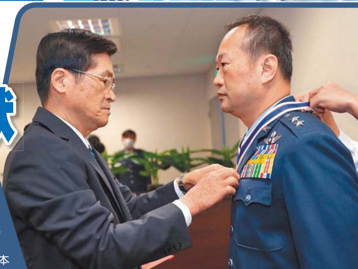
國防部長嚴德發昨日頒授空軍司令部政戰主任王純雄中將等 3 位屆退將官勳獎章，表彰他們軍旅期間卓越貢獻。

嚴部長期許他們在卸下戎裝後，能一本在軍中積極、樂觀的態度，調整生活步調，多陪伴家人；此外，也能夠持續對國防施政、建軍備戰提供寶貴建言。