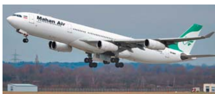
↑馬漢航空 A340 客機在敘國領空遭美軍戰機攔截，緊急爬升後造成多名乘客受傷。圖為馬漢航空 A340-300 客機。

10363 公尺短暫爬升至 10546 公尺，1 分鐘內又恢復原本高度，造成數名乘客撞傷頭部。