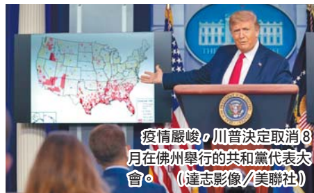
疫情嚴峻，川普決定取消 8 月在佛州舉行的共和黨代表大會。