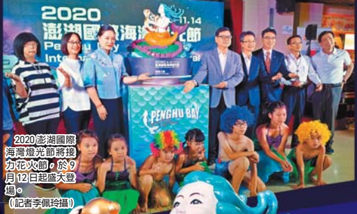
2020澎湖國際海灣燈光節將接力花火節，於9月12日起盛大登場。

為讓遊客能更加了解澎湖歷史人文脈絡，今年海灣燈光節也規劃藝文導覽講座「走進歷史的放映室」與「溯訪菊島·文化踏島之旅」導覽活動，讓遠道而來的旅客，能尋溯澎湖歷史文化，本島民衆也能提升在地藝文活動參與度，相關資訊可上網至澎湖國家風景區網站查詢。