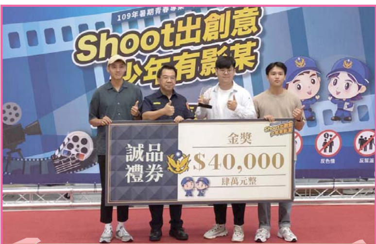
中市警局「少年有影某」微電影徵件比賽，亞洲大學「錯，過」奪得金獎。 (記者張好甄攝)