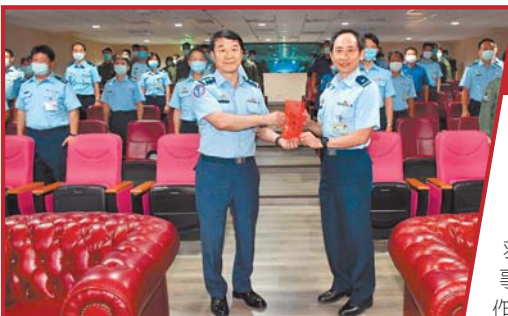
↑ 空軍司令熊厚基上將昨日赴新竹基地慰勉「0716 專案」搶救人員，並頒發加菜金，慰勉官兵執勤辛勞。