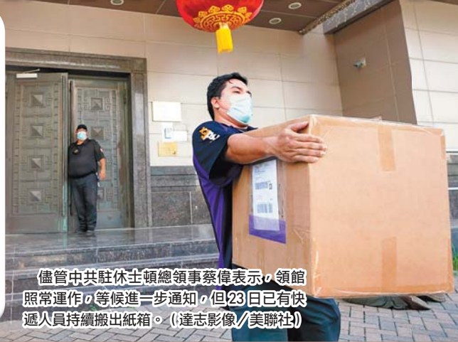
儘管中共駐休士頓總領事蔡偉表示，領館照常運作，等候進一步通知，但23日已有快遞人員持續搬出紙箱。

不過，約翰霍普金斯大學教授孔誥輝表示，蔡偉不太可能有權決定領館是否持續運作，認為北京有可能到最後一刻才會下令。