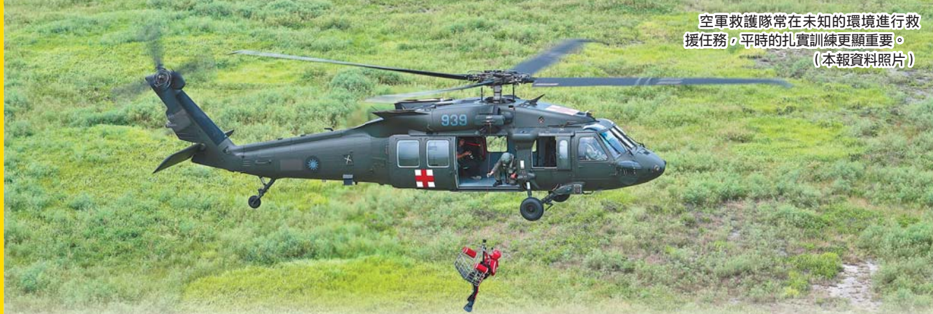
空軍救護隊常在未知的環境進行救援任務，平時的扎實訓練更顯重要。