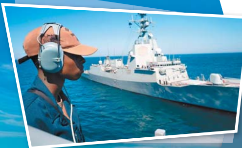
▲「波特號」上的美軍水兵，眺望一同參演的西班牙「阿瓦羅·德·巴贊號」(F101)巡防艦。