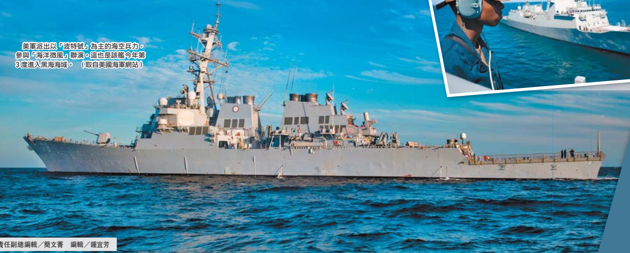
美軍派出以「波特號」為主的航空兵力，參與「海洋微風」聯演。這也是該艦今年第3度進入黑海海域。