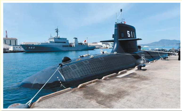
日本海上自衛隊「蒼龍」級潛艦「鳳龍號」(SS-511)是全球第1艘配備鋰電池的傳統動力潛艦。

基於這些情況，技術研究本部確定以斯特林主機作為潛艦的AIP系統，它比燃料電池更可行，並於1986年開始進行基礎研究。早在1983年，瑞典Kockums公司採用了這種技術，用於原型主機測試。1988年，在「內肖」級潛艦安裝批量生產型的4V-275R Mk.I模型發電機組，並進行海上試航，1992年，裝配在量產的Mk.II型「哥特蘭」級潛艦上。