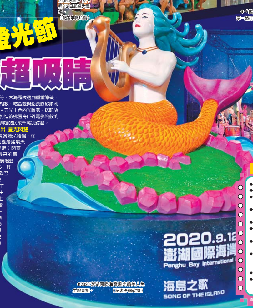
2020澎湖國際海灣燈光節美人魚主燈亮相。