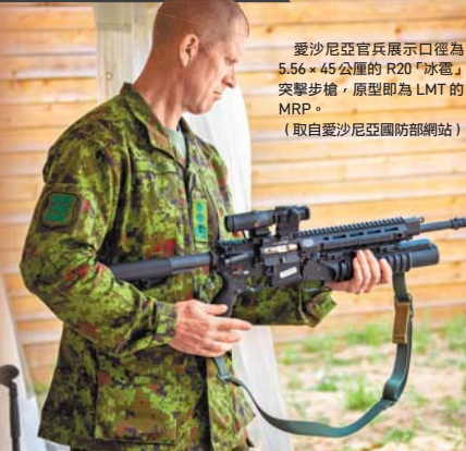
愛沙尼亞官兵展示口徑為5.56×45公厘的R20「冰雷」突擊步槍，原型即為LMT的MRP。

LMT製造的AR系列突擊步槍由於「物美價廉」，除生產軍規零組件獲美軍採用，成槍近年也被英國、紐西蘭等多國軍警採用。