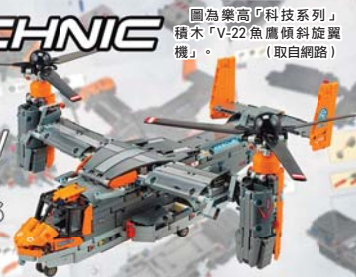
圖為樂高「科技系列」積木「V-22魚鷹傾斜旋翼機」。(取自網路)

Bell Boeing V-22 Osprey (42113) Instructions