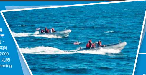
▲美軍人員乘坐小艇，進行海上演訓。

雖然美軍與北約並未表明，但近年來俄國在黑海與周邊區域的擴張意圖，無疑是「海洋微風」聯演意欲嚇阻的主要對象，且俄國自17日起，已下令南方軍區、克里米亞半島與黑海艦隊等單位進入「突擊抽測戰備演習」狀態，官媒「塔斯社」也證實俄軍正在監控「波特號」動向，使雙方對立情勢急遽升高。