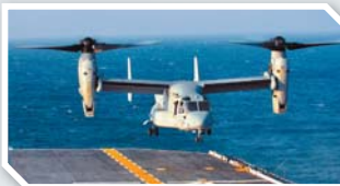
▲樂高發行「V-22魚鷹傾斜旋翼機」積木套裝，已取消上市。圖為「現實世界」中，於大西洋執行任務的美軍V-22魚鷹機。