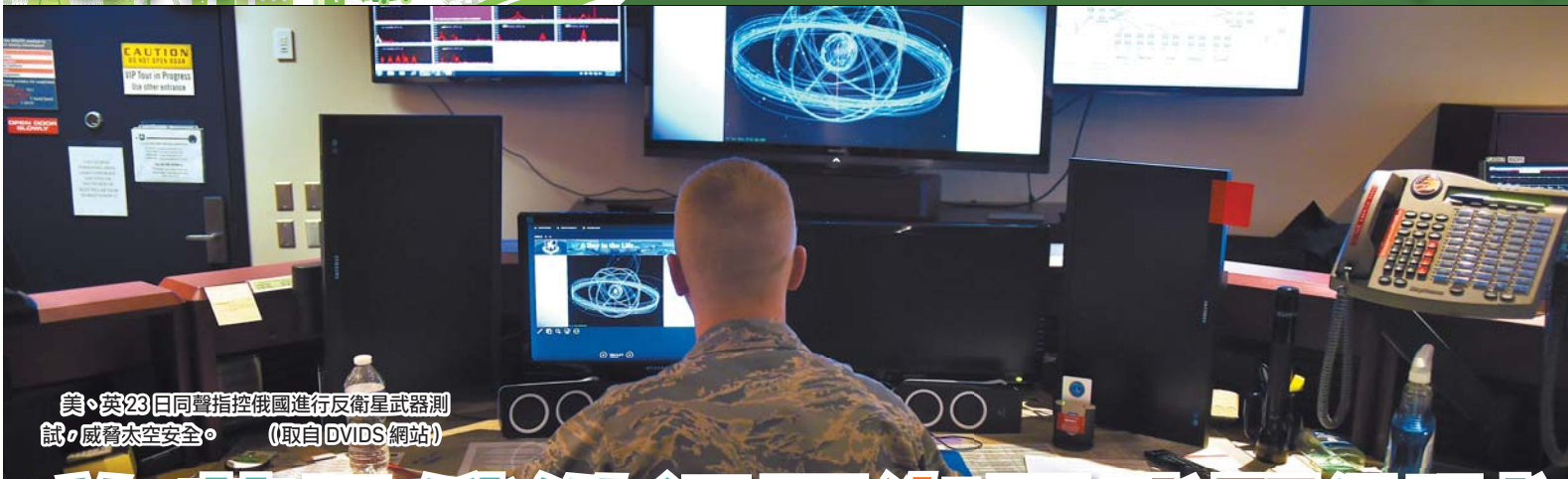
美、英23日同聲指控俄國進行反衛星武器測試，威脅太空安全。