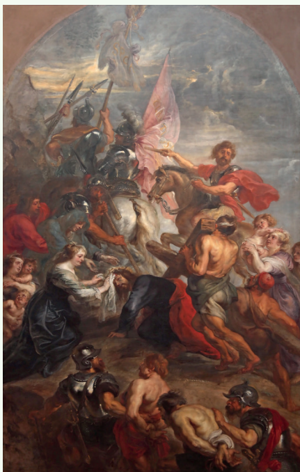
Peter Paul Rubens - La montée au Calvaire