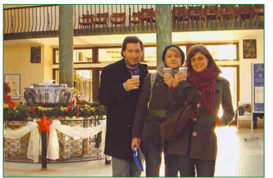
Vincenka - nejznámější z luhačovicových pramenů. Na zdraví!

Ve černém diskuzím v Hotelu Fontána, ukrytém v luhačovicích lesích, vedla česká architektka pracující v Curychu,