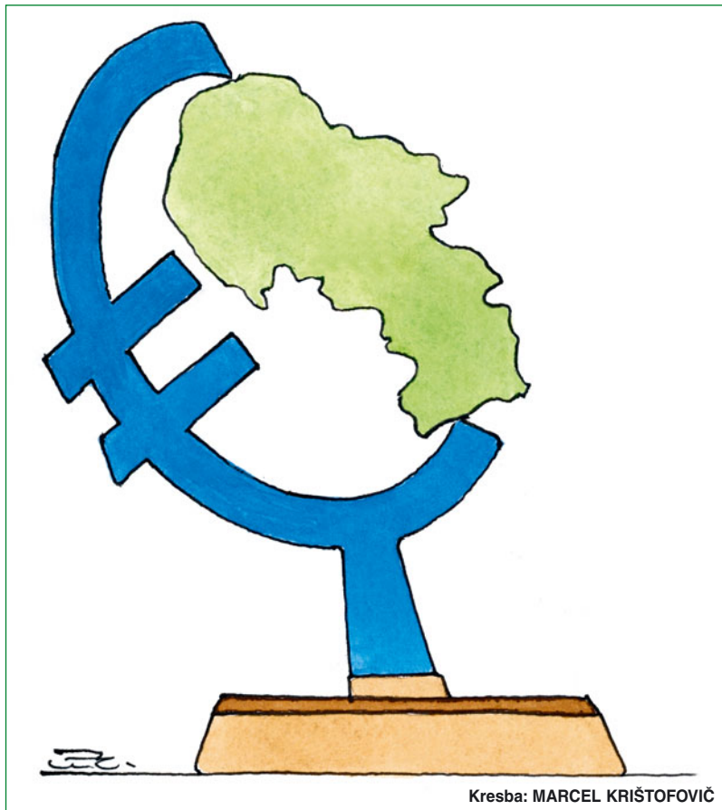
Kresba: MARCEL KRIŠTOFOVIČ

1. 2. 1909 - narodil sa Emanuel Böhm , slovenský chemik, politik a vydavateľ. Bol ocenený za prínos pre potravinový a nápojový priemysel. Získal patent na prístroj, ktorý vyvinul na analýzu obsahu nápojov.