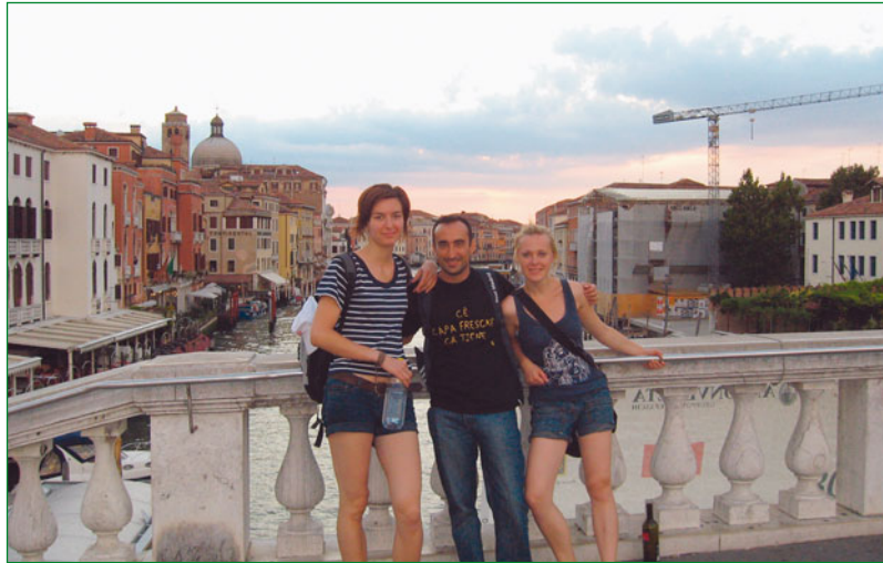
Cesta plná dobrodružstiev a náhod nás zaviedla až do Benátok.