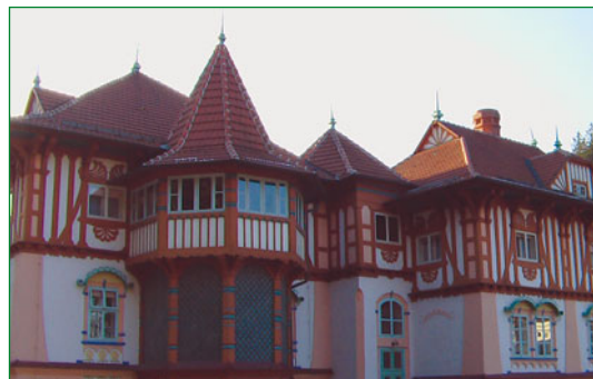
Dominantou lázní je stylový Jurkovičův dům.

nazývá spíše novým výrazem městokrajina. Přednášku chtěl rozvířit šifricí se „epidemii“, které dal jméno „sídelní kaše“ (urban sprawl). Důrazně poukazuje na původní krajinu, která nám doslova mizí před očima a plíživě se mění na „městokrajinu“. Za vším stojí idylická představa o bydlení v idylickém obraze na okraji měst. Původní obraz se tak ničí a hranice nenarušeného se posouvají dál a dál, až se města začínají spojovat. Území mezi nimi kypí „kaší“ domků, výrobních a prodejních hal, nadjezdů a podjezdů, čerpacích stanic,