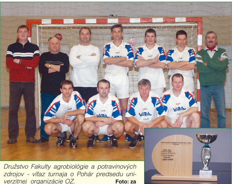
Družstvo Fakulty agrobiológie a potravinových zdrojov - víťaz turnaja o Pohár predsedu univerzitnej organizácie OZ.

Podmienky: - ukončené VŠ, prípadne ÚSO vzdelanie so zameraním na pozemné stavby, - prax v investičnej činnosti minimálne 3 roky, - uchádzač musí byť držiteľom osvedčenia o odbornej spôsobilosti vo výstavbe podľa zákona SNR č. 138/1992 Zb. v kategórii pozemné stavby, - bezúhonnosť, zodpovednosť, dôveryhodnosť. Svoje žiadosti spolu s profesijným životopisom zasielajte do 2. 2. 2009 na adresu Rektora SPU, Útvar personalistiky, EP a MU, Tr. A. Hlinku 2, 949 76 Nitra.