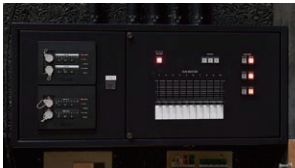
大ホール / 舞台袖操作盤・EMIT-AX