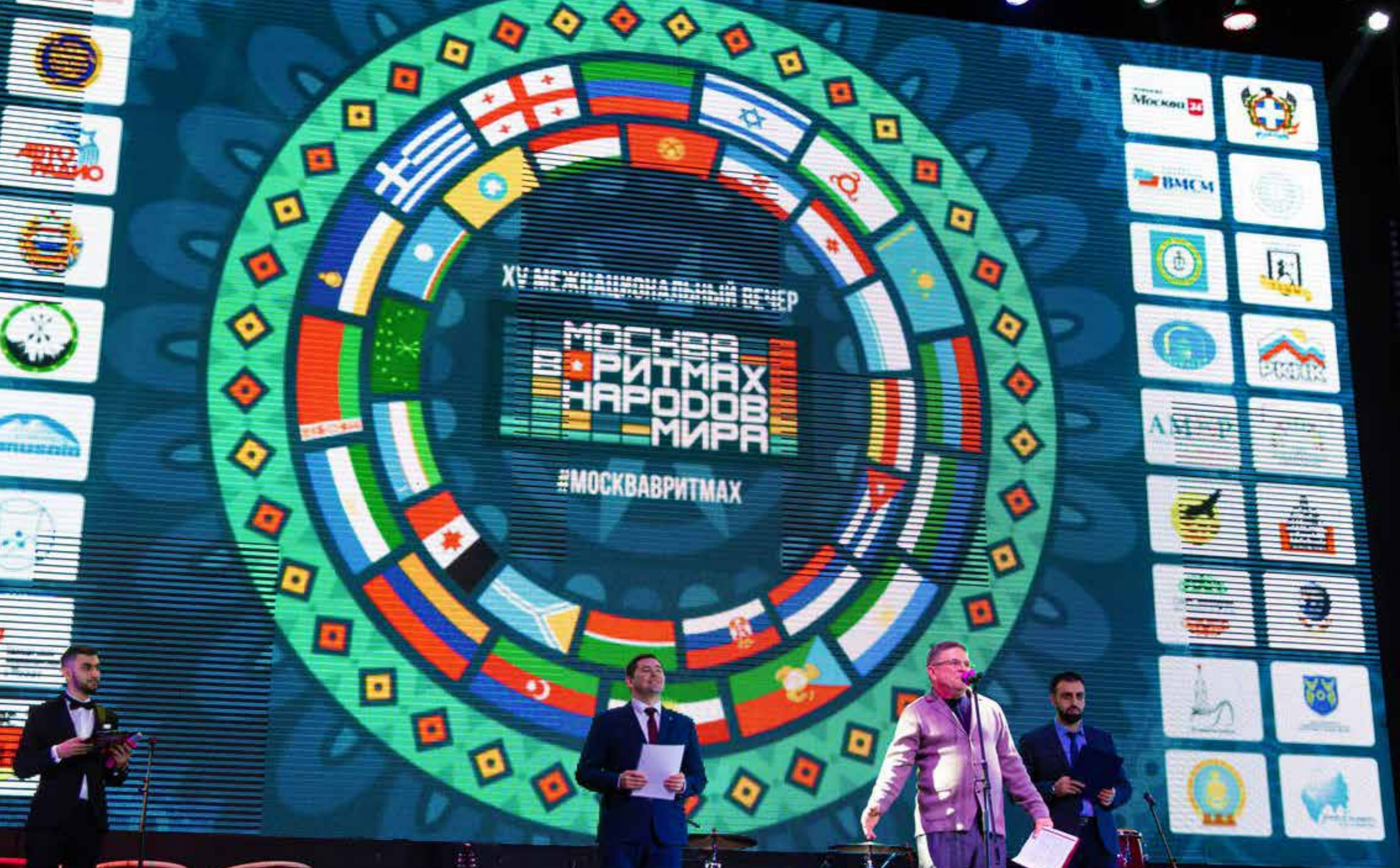
XV Межнародный вечер «Москва в ритмах народов мира»