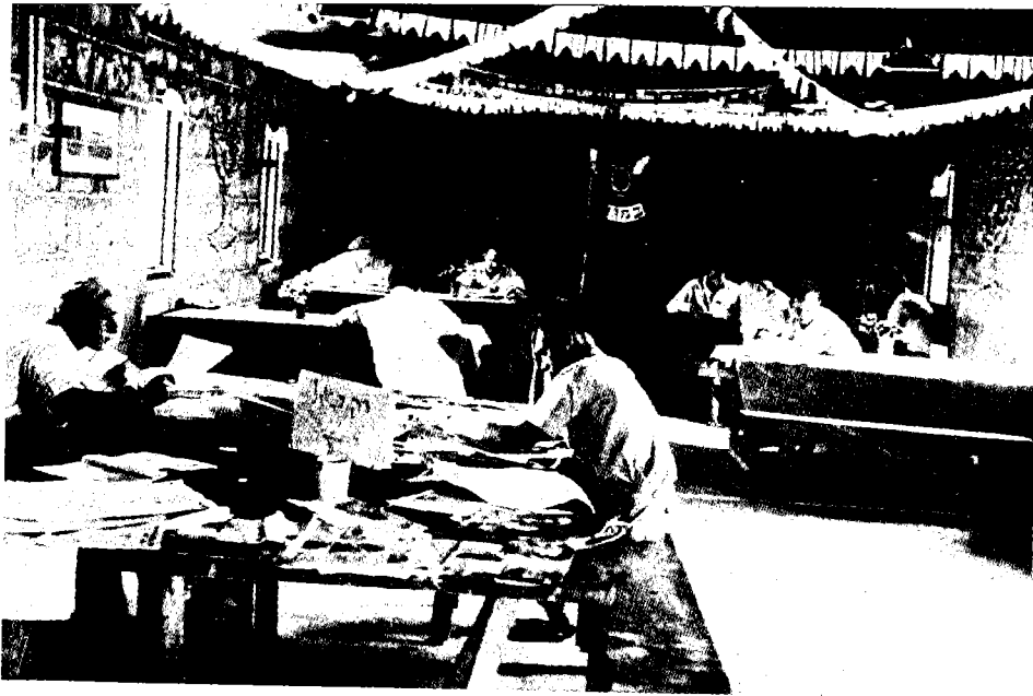
חדר הקריאה והכתיבה, מחנה גילגול

ברור היה לחלוטין, כי נשללה האפשרות שישובו ארצה לפני תום המנדט. ניתן היה אמנם לפרש את ההודעות בצורה מחמירה, שהכוונה להחזיר את העצורים לקראת סוף יולי, אבל ניסוח זה של ההודעות הגביר את אי-האמון והחשדנות הבסיסית של העצורים כלפי הבריטים, עד שאיש מהם לא היה מוכן לשים מבטחו בהן. על-כך תצביע יותר מכל העובדה שהעצורים המשינו בהכנות לבריחה מהמחנה חרף הסכנות הכרוכות במבצע. הבריחה אף נועדה להיות אמצעי לחץ לזיכרון השבתם ארצה זאת בהנחה כי בעקבות הבריחה יגבר פחדה של האוכלוסייה הלבנה בקניה מן המחנה והיא תלחץ על המושל לפנותו מן המושבה. 45