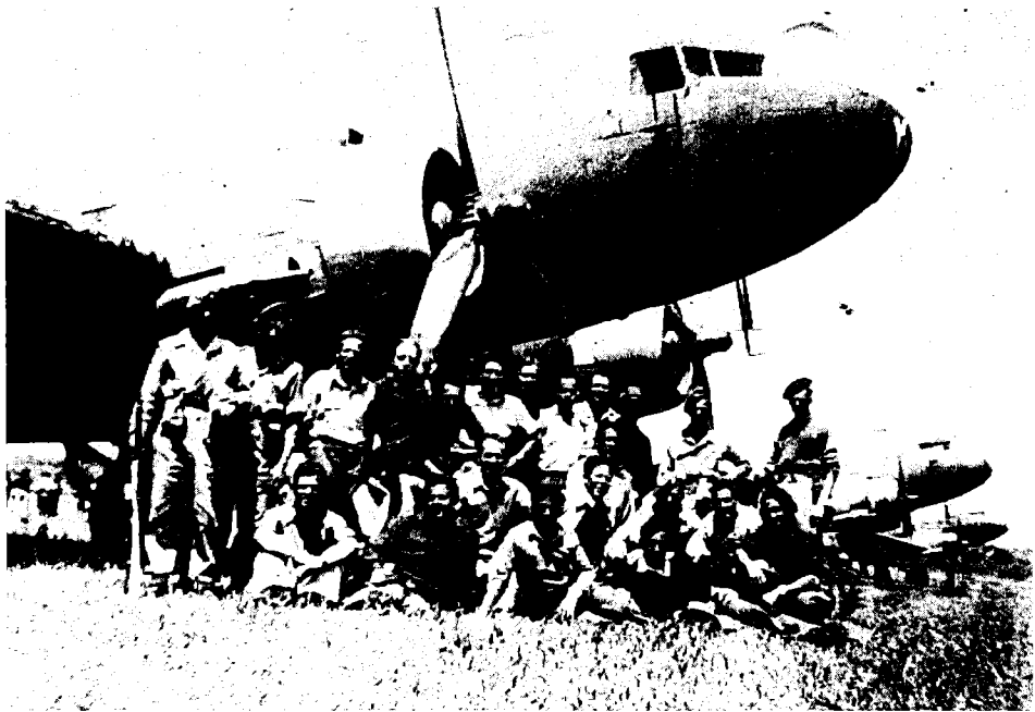
חניית בניינים בדרך ארצה. גזבר שבגבול סודאן (7 ביולי 1948)