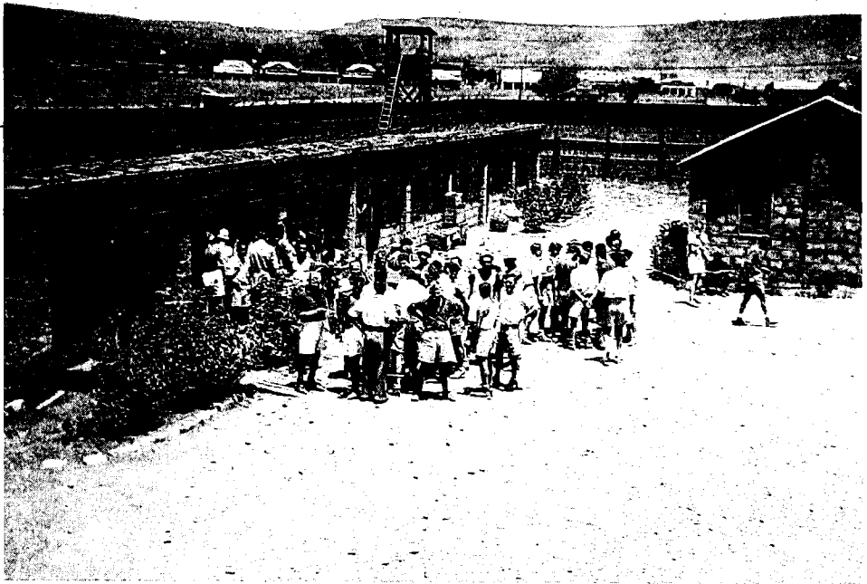
העצירים ליד קנטינת המחנה

היהודית והערבית) או אוטוריטה אחרת שתירש את השלטון הבריטי. משרד-המלחמה הביע ספק אם הללו יאותו להחזיק את הגולים שהושבו לארץ, שכן מרביתם עצורים במשך שנים על סמך חשד בלבד, בלא שהורשעו בדיון. 11 בסופו של דבר העריך משרד-המלחמה כי ניתן יהיה להתגבר על קושי זה (כנראה על-ידי החזקתם במעצר באיזור שתוכנן כאחרון לפינוי), ואף-על-פי-כן עדיין היה מודאג מן הסכנה שהנסיגה תשתבש בשל החזקת העצורים בכלא בארץ-ישראל. 12