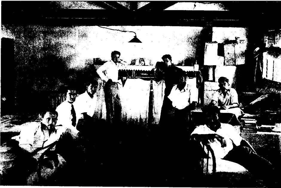
בתוך אחד הצרפים בגילגיל

ואכן, למן הגירוש הראשון ולאורך תקופת זמן ממושכת גילו הנהלת הסוכנות ואף הוועד הלאומי אדישות ניכרת לגורל העצורים באפריקה ולעתים אף התעלמו מהם התעלמות מוחלטת. 27 פרשת רציחתם של שני עצורים ופציעת שנים-עשר מהם על-ידי המשמר הסודני ב-17 בינואר 1946, כאשר המחנה היה באריתריאה, הוציאה מעט את מוסדות היישוב מאדישותם. 28 הנהלת הסוכנות הביעה אז את מחאתה נגד המעצר ללא משפט והגירוש. אך עם זאת היא השתדלה לצמצם את מעורבותה בעניין. משיקולים פוליטיים התנגדה הסוכנות לדרכי המאבק של האצ"ל והלח"י, ועל-כן היא העדיפה להטיל את עיקר הפעילות למען העצורים על כתפי הוועד הלאומי. 29 — מוסד פנים-יישובי, אשר בניגוד לסוכנות לא עסק בייצוג פוליטי של היישוב כלפי גורמי חוץ. גם הוועד הלאומי לא מיהר להיכנס בעובי הקורה, ורק בפברואר 1947 הקים את אגודת 'לאסירינו'. זו אכן עשתה רבות לעזרת העצורים ובני משפחותיהם, אף-כי בסופו של דבר פעלה באורח עצמאי וללא תלות בוועד הלאומי. 30