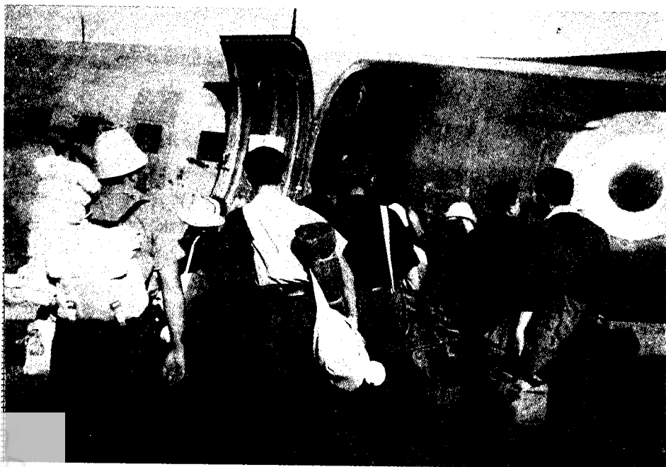
בעלייה לאחד המטוסים המחזירים את העצורים לארץ (יולי 1948)

ההתנגשות הקטלנית בין ממשלת ישראל לבין האצ"ל, סברה, כי יש סיכוי שהצד הערבי יביט בצורה אחרת, חיובית יותר, על החזרת גולי קניה לארץ, וזאת משום שהדבר עלול לערער את יציבות המדינה היהודית מבפנים, בבחינת תוספת שמן למדורת המתיחות בין חוגי האצ"ל לבין ראשי המדינה היהודית. 94 אבל ניתן להעריך את הדברים בצורה הפוכה. אפשר כי העובדה שבמהלך פרשה זו הוכח כלפי פנים וכלפי חוץ שהאצ"ל אינו עוד בגדר טוען לשלטון במדינה, היא שהקלה על הבריטים להחליט להשיב את הגולים ארצה. פרשת 'אלטלנה' הביאה לקרע מוחלט ביחסים שבין הממשלה הזמנית של מדינת ישראל לאצ"ל. בלילה שלאחר ה-22 ביוני – היום שבו הופגזה 'אלטלנה' על-ידי כוחות צה"ל – החל מבצע 'טיהור' שערכו חטיבות פלמ"ח ואנשים מחטיבת 'קרית' לשבירת התנגדות האצ"ל. רבים מאנשי האצ"ל נעצרו ופורקו מנשקם. האצ"ל הגיב ב-24 ביוני בהודעה פומבית ובה מסר בין היתר, כי איננו מכיר עוד בממשלה הזמנית של מדינת ישראל ודרש את התפטרותה המיידית. לא יפלא אפוא מדוע הגבירה פרשת 'אלטלנה' גם את התעניינות משרד-החוץ הבריטי בעמדת הרשויות הישראליות לגבי החזרת העצורים. כאשר נבדק העניין אצל לינטון (Joseph Linton) המזכיר המדיני במשרד הסוכנות היהודית בלונדון, התברר כי רשויות המדינה היהודית רוצות בהחזרת העצורים לארץ-ישראל ללא דיחוי. 95 שאיפה זו של הרשויות הישראליות טעונה הסבר, על רקע היחסים המתוחים בין האצ"ל לבין