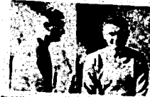
These are the men