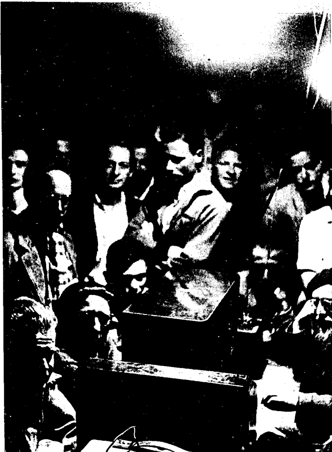
העצירים מאזינים לשידור ההצבעה בעצרת האו"ם (29 בנובמבר 1947)

ישראל העלה בעיני הבריטים את חשיבותה של השפעתם במדינות ערב, והם הגבירו את תמיכתם במדינות אלה. הדבר נתן אותותיו בפרק הזמן שלאחר החלטת האו"ם. הבריטים התנערו מהחלטת החלוקה — שהעולם הערבי התנגד לה, ונמנעו מכל פעולה שעשויה היתה להתפרש כסיוע לכינון מדינה יהודית. 3 באיזו מידה השפיעה מגמתה הפרו-ערבית של ממשלת הלייבור על סוגיית השבת גולי קניה? האם סירובם העקשני של הבריטים להיעתר לתביעת הגולים להחזירם לארץ-ישראל נבע מתוך שאיפה לרצות את העולם הערבי או לפחות לא להרגיזו? כלום ראו הבריטים בגולים גורם העשוי להיות בעל משמעות במלחמה הניטשת בין ערבים ליהודים בארץ-ישראל? האם הוטרדו הבריטים מתפיסתם הציונית-האקטיביסטית של הגולים בדבר מדינה יהודית בשני עברי הירדן? האמנם חששו להשיבם לארץ בראותם כם גורם העלול לחזק את מגמתו של האצ"ל להתפשט לעבר ממלכתו של עבדאללה שהיתה נתונה תחת אפטרופסותם? התשובות לשאלות אלה חלקן ניתן לבדיקה וחלקן יישאר לעולם בתחום ההשערה. במאמרי זה, המוקדש לבדיקת ההיבט הבריטי שבהשבתם של גולי קניה לארץ-ישראל כפי שהוא משתקף במסמכים הבריטיים מאותה תקופה, ייעשה נסיון להטיל אור על שאלות אלה.