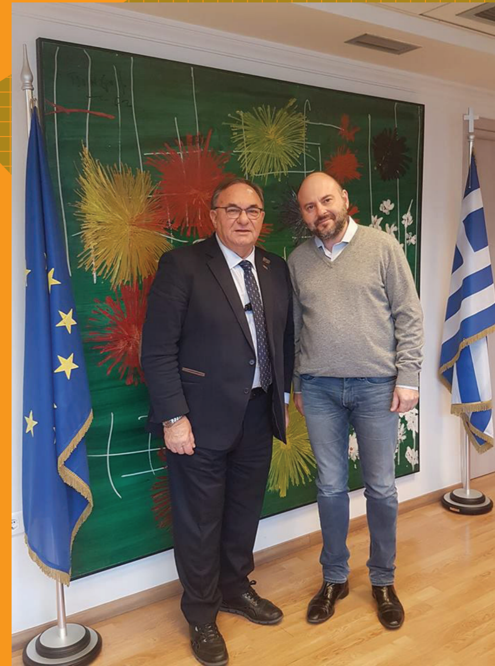
Ο Πρόεδρος της ΕΕΤΑΑ Δ. Καλογερόπουλος (αριστερά) με τον Πρόεδρο του ΤΕΕ Γ. Σιασινό (δεξιά)

Ανάμεσα στα θέματα που συζητήθηκαν στη συνάντηση, ήταν και το Πρόγραμμα «Λειτουργία Δικτύου Οριζόντιας Υποστήριξης Δήμων και φορέων τους, ως δυνητικά δικαιούχων του τομέα Περιβάλλοντος του ΕΠ ΥΜΕΠΕΡΕΑΑ 2014 – 2020», που έχει αναλάβει να υλοποιήσει η ΕΕΤΑΑ, με χρηματοδότηση από το ΕΠ ΥΜΕΠΕΡΕΑΑ 2014-2020. Ο κ. Καλογερόπουλος διευκρίνισε στον κ. Σιασινό ότι πρόκειται για ένα πολύ σημαντικό Πρόγραμμα που στοχεύει στην ενημέρωση όλων των αποφασιστικών οργάνων των Δήμων, ΔΕΥΑ και ΦΟΔΣΔΑ της χώρας για τις προσκλήσεις που εκδίδονται από το ΕΠ ΥΜΕΠΕΡΕΑΑ 2014-2020 και τις οποίες μπορούν να αξιοποιήσουν και εν συνεχεία στην υποστήριξη των αρμόδιων Υπηρεσιών, Τεχνικών και Προγραμματισμού των Δήμων, των στελεχών ΔΕΥΑ και ΦΟΔΣΔΑ για την υποβολή ολοκληρωμένων και έγκυρων προτάσεων. Απώτερος στόχος η μέγιστη αξιοποίηση των πόρων που αφορούν το περιβάλλον και για τους οποίους είναι δικαιούχος η Τοπική Αυτοδιοίκηση.