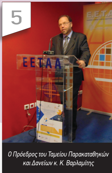
Ο Πρόεδρος του Ταμείου Παρακαταθηκών και Δανείων κ. Κ. Βαρλαμίτης