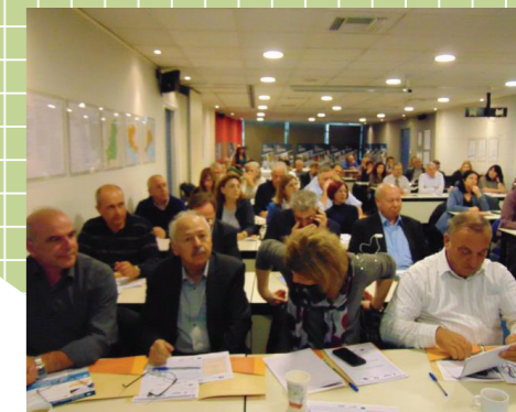
Με μεγάλη συμμετοχή πραγματοποιήθηκε και η Ημερίδα για τους φορείς ΤΑ της νησιωτικής Ελλάδας, στην Αθήνα, στα γραφεία της ΕΕΤΑΑ.