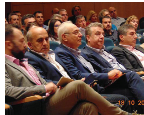
Ο Περιφερειάρχης Κρήτης κ. Στ. Αρναουτάκης, Δήμαρχοι και στελέχη της Περιφέρειας και των Δήμων της Κρήτης στην εκδήλωση του Ηρακλείου.