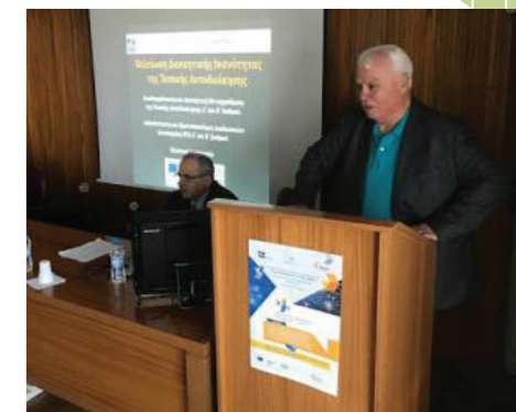
Ο Πρόεδρος της ΠΕΔ Στερεάς Ελλάδας στην ημερίδα της Λαμίας.