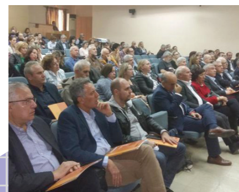
Ημερίδα στη Λάρισα.