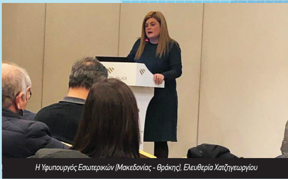
Η Υφυπουργός Εσωτερικών (Μακεδονίας - Θράκης), Ελευθερία Χατζηγεωργίου