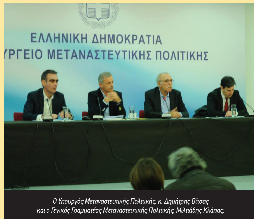
Ο Υπουργός Μεταναστευτικής Πολιτικής, κ. Δημήτρης Βίτσας και ο Γενικός Γραμματέας Μεταναστευτικής Πολιτικής, Μιλτιάδης Κλάπας.