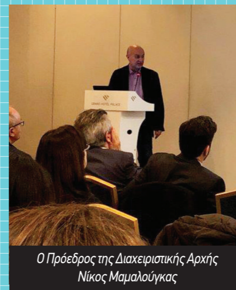
Ο Πρόεδρος της Διαχειριστικής Αρχής Νίκος Μαμαλούγκας

Βασικός στόχος της ημερίδας ήταν η παρουσίαση της α' φάσης του έργου του Δικτύου Εξωτερικών Συνεργατών που περιελάμβανε την αποτύπωση του «περιβαλλοντικού προφίλ» όλων των Δήμων και την καταγραφή των αναγκών τους σε έργα περιβάλλοντος. Για την αποτύπωση και την καταγραφή πραγματοποιήθηκαν ενημερωτικές συναντήσεις με τους Προέδρους και τα μέλη των Διοικητικών Συμβουλίων όλων των Περιφερειακών Ενώσεων