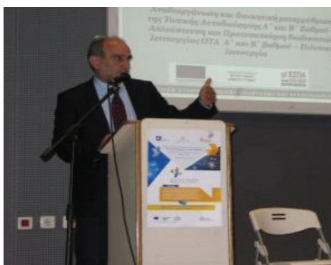
Ο Περιφερειάρχης Δυτικής Ελλάδας κ. Α. Κατσιφάρας και ο Πρόεδρος της ΠΕΔ Δυτικής Ελλάδας & Δήμαρχος Αγρινίου κ. Γ. Παπαναστασίου απευθύνουν χαιρετισμό.