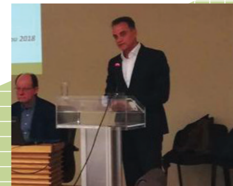
Ο Περιφερειάρχης Δυτικής Μακεδονίας κ. Θ. Καρυπίδης και ο Δήμαρχος Κοζάνης κ. Λ. Ιωαννίδης απευθύνουν χαιρετισμό στην Ημερίδα της Κοζάνης