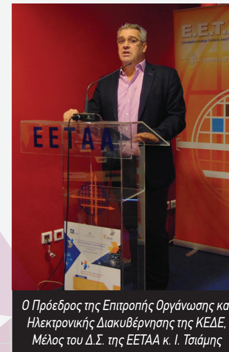
Ο Πρόεδρος της Επιτροπής Οργάνωσης και Ηλεκτρονικής Διακυβέρνησης της ΚΕΔΕ, Μέλος του Δ.Σ. της ΕΕΤΑΑ κ. Ι. Τσιάμης

θεί έργα ύψους άνω των 300 εκατ. ευρώ σε 70 δήμους της χώρας.