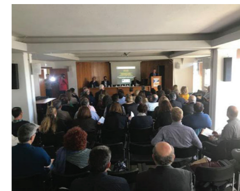
Ημερίδα στη Λαμία.