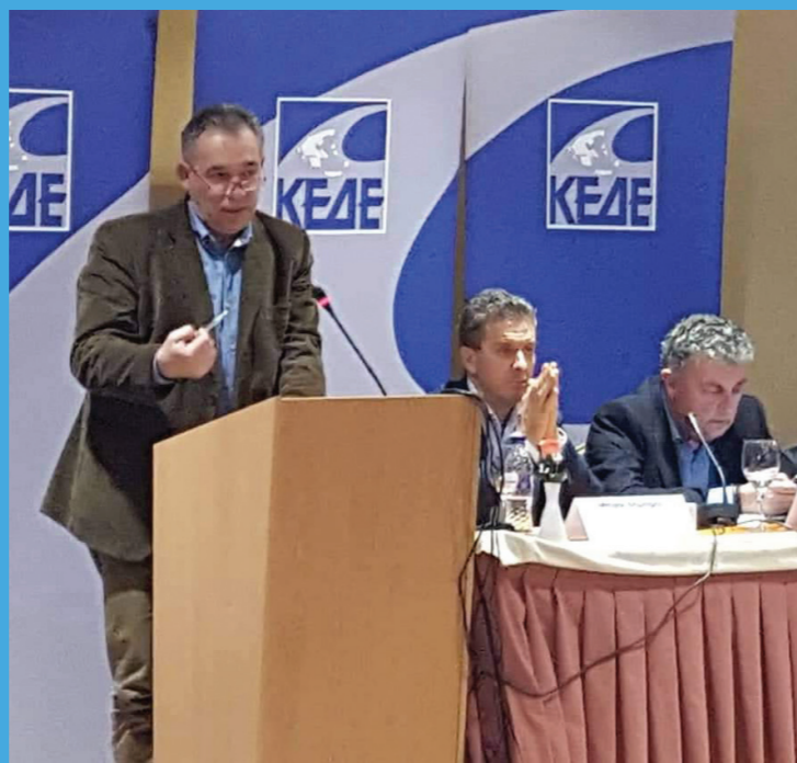
Ο Δήμαρχος Αιγάλεω και Μέλος του Δ.Σ. της ΚΕΔΕ, Δημήτρης Μπίρμπα