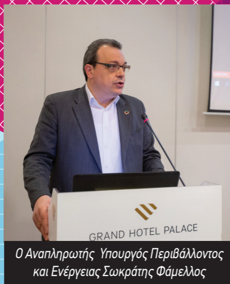
Ο Αναπληρωτής Υπουργός Περιβάλλοντος και Ενέργειας Σωκράτης Φάμελλος

και προτυποποίησης διαδικασιών λειτουργίας των ΟΤΑ», έργο «σημαία», που αποσκοπεί στον εκσυγχρονισμό της λειτουργίας της Αυτοδιοίκησης. Τέλος, αναφέρθηκε στην κρισιμότητα της λειτουργίας του Δικτύου εξωτερικών συνεργατών της ΕΕΤΑΑ για την μεγαλύτερη απορρόφηση των πόρων του ΕΠ ΥΜΕΠΕΡΑΑ και την προώθηση των έργων που αφορούν στο περιβάλλον.