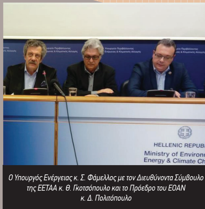
Ο Υπουργός Ενέργειας κ. Σ. Φάμελλος με τον Διευθύνοντα Σύμβουλο της ΕΕΤΑΑ κ. Θ. Γκοτσόπουλο και το Πρόεδρο του ΕΟΑΝ κ. Δ. Πολιτόπουλο

Όσον αφορά στο διεθνές πλαίσιο, ήδη υπάρχει υπογεγραμμένο πλαίσιο συνεργασίας με τη Γ.Γ. Εμπορίου και την ΕΕΤΑΑ και εκτιμάται ότι οι διαδικασίες θα ολοκληρωθούν σύντομα. Το ύψος του προϋπολογισμού για τον διαγωνισμό εκτιμάται στα 13 εκατ. ευρώ.