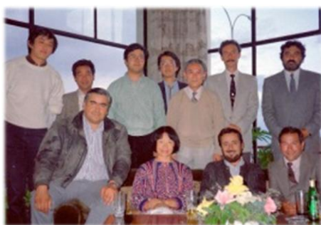
Foto 6 : Reunión de camaradería en el Hotel Perez Rosales de Puereto Montt.