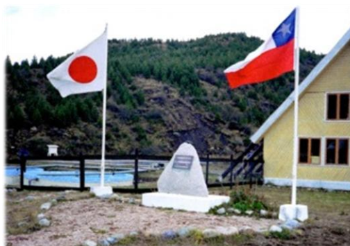
Foto 3 : Piscicultura de Coyhaique donde flamean la bandera de Chile y Japón.

Cuando DAISUI envió la primera misión a Coyhaique a principios de Enero en 1970 y la segunda misión entre mediados y a fines de Febrero de 1971, efectuaron la investigación para determinar el mejor lugar para la instalación de piscicultura. Esta piscicultura se terminó de construir en 1976. El monumento conmemorativo tiene la siguiente inscripción: