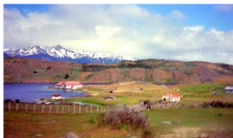
Foto1: Estancia Puerto Consuelo, ubicada en el centro del fiordo Eberhardt. ( Fotografía : Sharihata 18 de Diciembre 1986 )

A la izquierda el mar frente a la estancia Puerto Consuelo, aquí la segunda misión de DAISUI efectuaron trabajos de investigación del medio ambiente en Febrero de 1971. En 1893, el capitán Hermann Eberhardt de Silesia, Alemania, junto a otros inmigrantes llegaron a este lugar como pioneros. Hoy sus descendientes permanecen en este lugar.