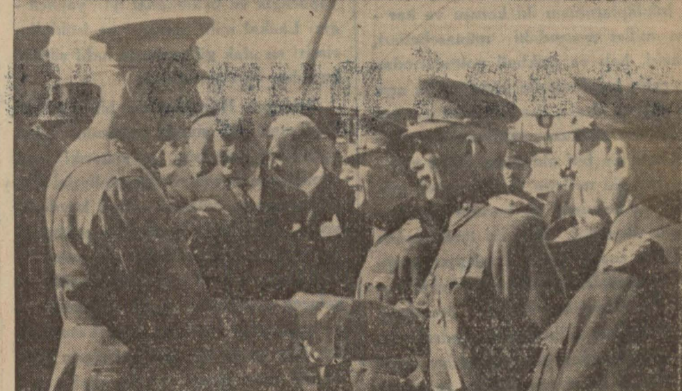
Gazi Hz., Şehinşah Hz. ne kumandanlarımızı takdim ediyor