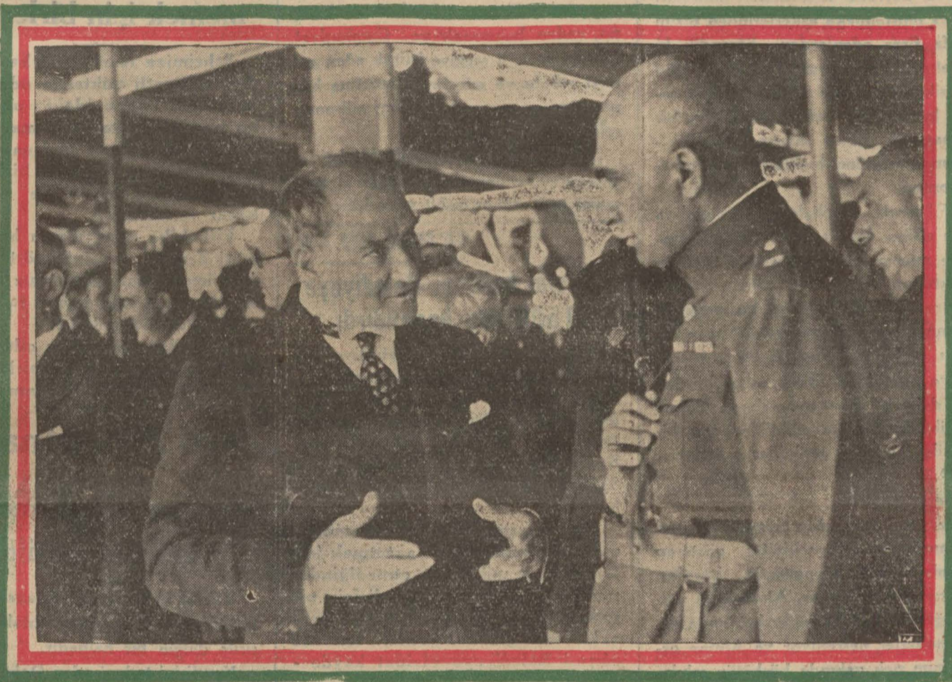
Reisicumhur Hazretleri, Kınalıada vapurunda muhterem misafiri mizle görüşüyorlar

Gülcehal, saat 11 de Adalar açıklarına geldi, coşkun tezahüratla karşılandı, Kavaklara kadar bir cevalân yapıldıktan sonra Şehinşah Hazretleri Gazi Hazretleri 15 te Sarayburnunda karaya çıktılar