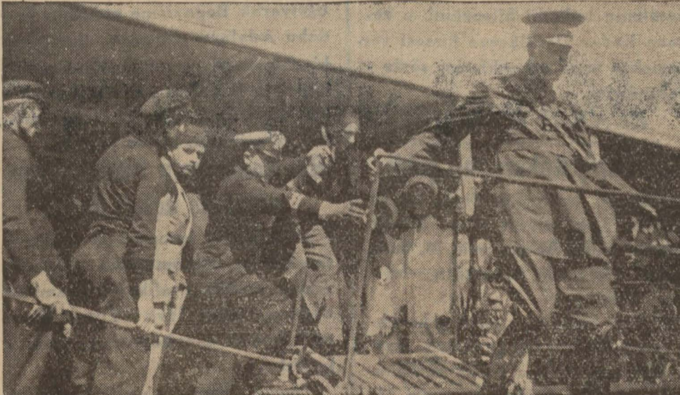
Şehinşah Hazretleri vapurdan çıkıyorlar