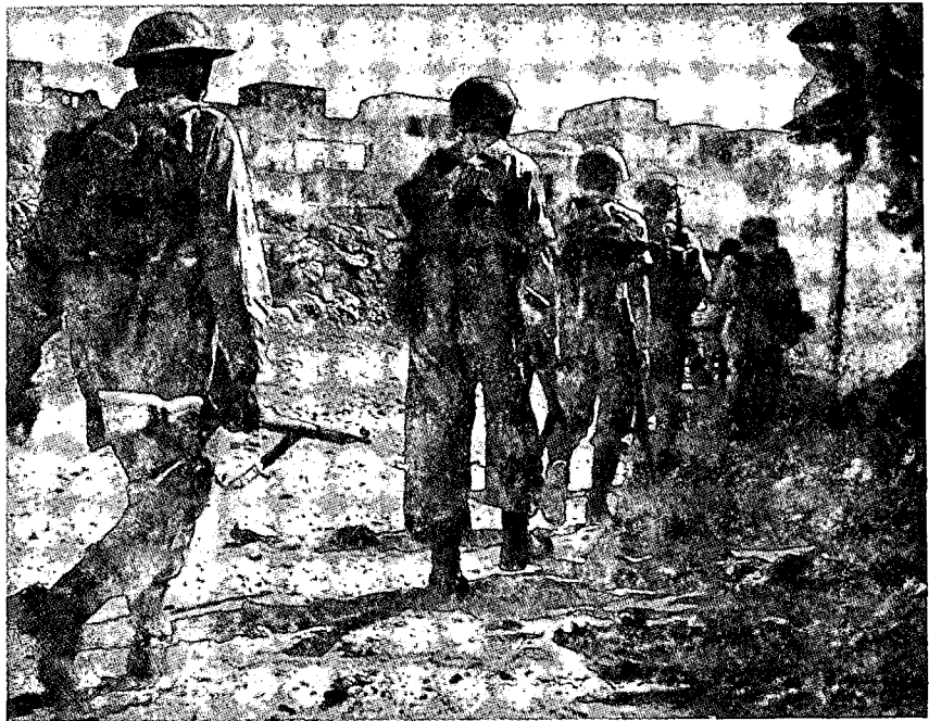
כוחות צה"ל נכנסים לכפר לוביה

משך כל עת ההפוגה המשיך, כאמור, "צבא ההצלה" בפיקודו של קאוקג'י בהציג קותיו ליישובינו, במערב ובמזרח, מתוך בסיסים במרכז הגליל. קרבות קשים ומתישים במיוחד התנהלו כל העת באזור