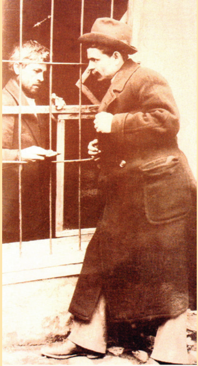
Manaki Kardeşler

Osmanlı'nın son döneminden bugüne dek devam eden kimlik tanımı üzerindeki tartışmaların, Türk film tarihi yazımı ve tanımı üzerinden de sürdüğüne tanık oluyoruz bir bakıma.