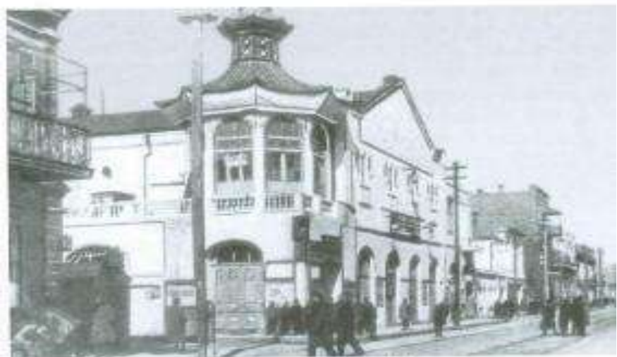
"Mikado" teatrının binası