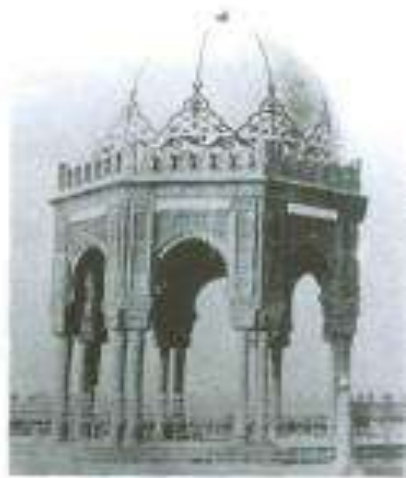
Axund Turabın Mərdəkandakı qəbr-əbədəsi