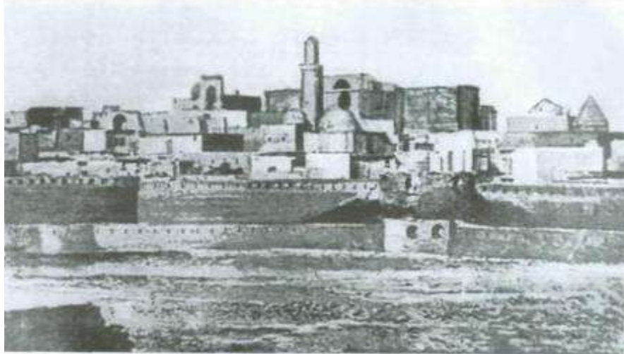
İçeri şehir. XVIII əsr.