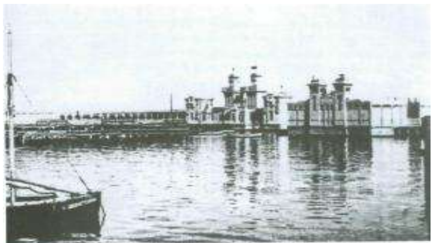
Bakı dəniz hamamı