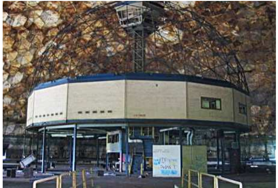
So stellen sich die Panacea-Leute ihr physisches Forschungszentrum vor.

Bei Kontakten ist zu beachten, dass sich die Panacea-University in der australischen Zeitzone (Brisba-