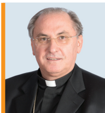
† Celso Morgia Iruzubieta Arzobispo de Mérida- Badajoz