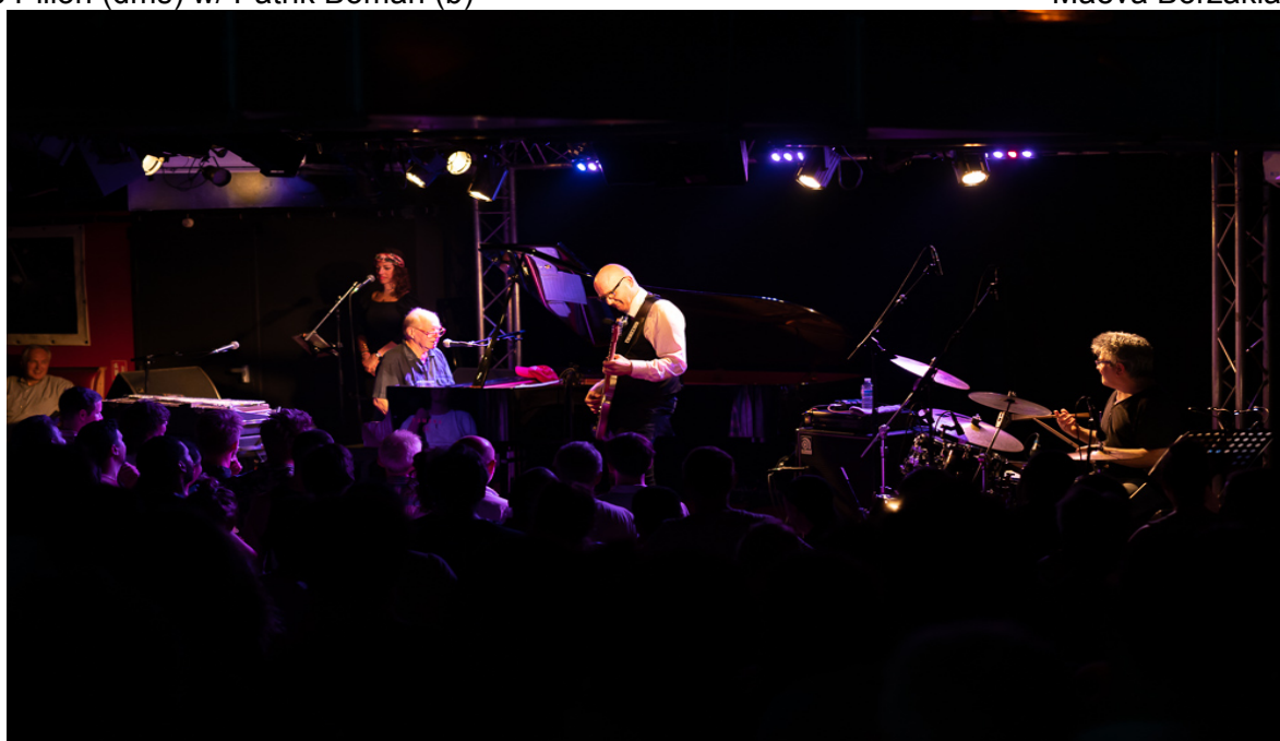
Cortex, New Morning Paris, June 2019