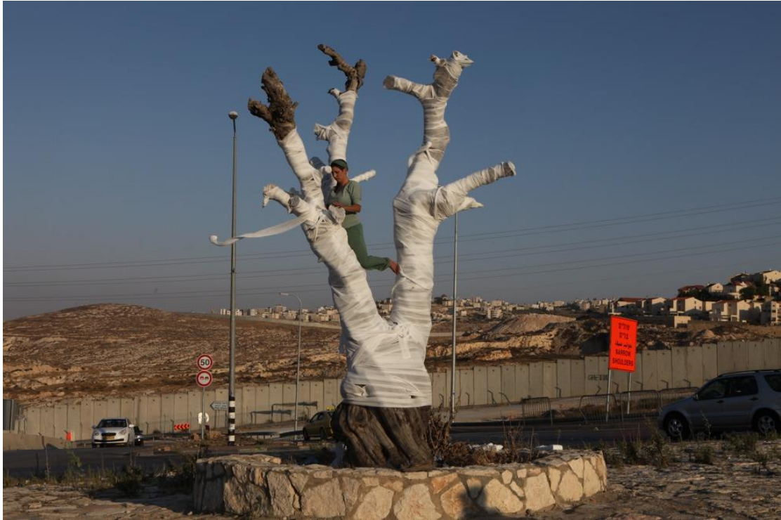
תמונה מס' 6. אריאן ליטמן, עץ הזית, מיצג, יולי 2011.

את המיצג "המעין" היא ביצעה בברירת המעין בליפטא, במקורה כפר ערבי במבואותיה הדרומיים של ירושלים אשר תושביו הפלסטיניים נמלטו ממנו במהלך קרבות מלחמת העצמאות. עד היום מתנהל מאבק משפטי על זכויות הקרקע והבתים במקום. מיצג זה מתבסס על החלפת והעברת תפקידים מאישה לאישה, כאשר האחת תופרת בעוד השנייה, השוכבת כמומיה עטופה, קמה, מסירה את התחבושות ונכנסת להיטהר במי המעיין. לאחר הטיהור היא הופכת להיות התופרת הבאה.