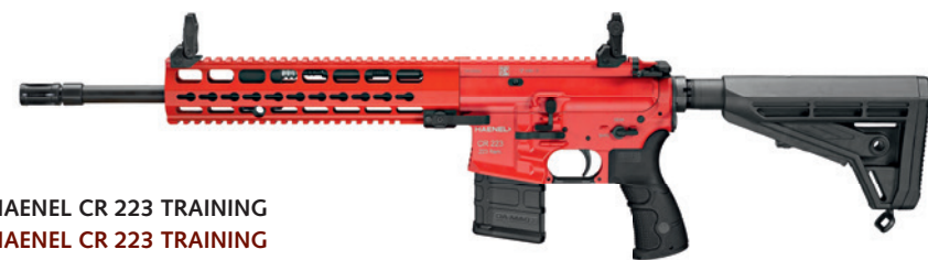
HAENEL CR 223 TRAINING HAENEL CR 223 TRAINING

A functional exercise rifle for the training of handling, loading, unloading and malfunction situations. The rifle corresponds to the original but without the capacity to shoot.