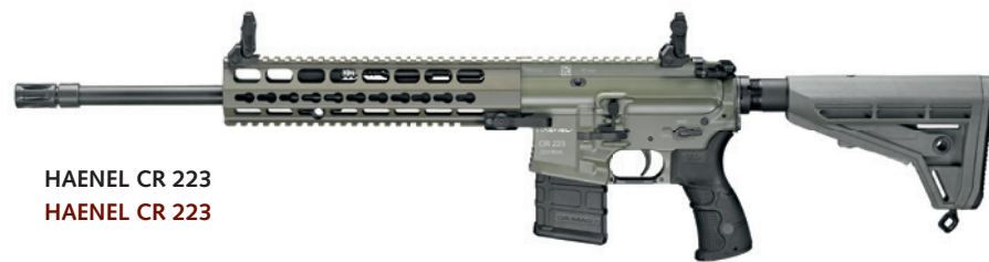
HAENEL CR 223 HAENEL CR 223