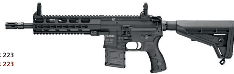
HAENEL CR 223 HAENEL CR 223