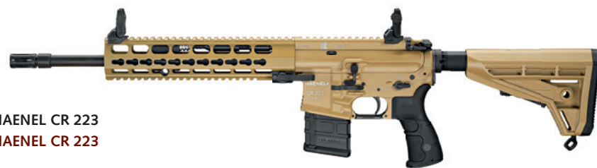
HAENEL CR 223 HAENEL CR 223

The Haenel CR 223 is a semi-automatic rifle in calibre .223Rem., which experienced functional revisions, exceeding the AR-15/M4 standards. Also available in the extremely durable and resistant Ilaflon coating in the colour "green-gray / RAL7013".