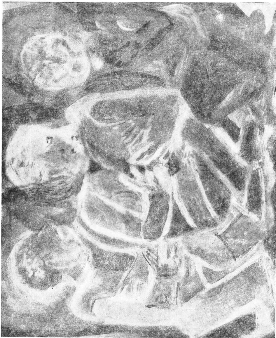
Gancz Miklós: Proféták (1976)