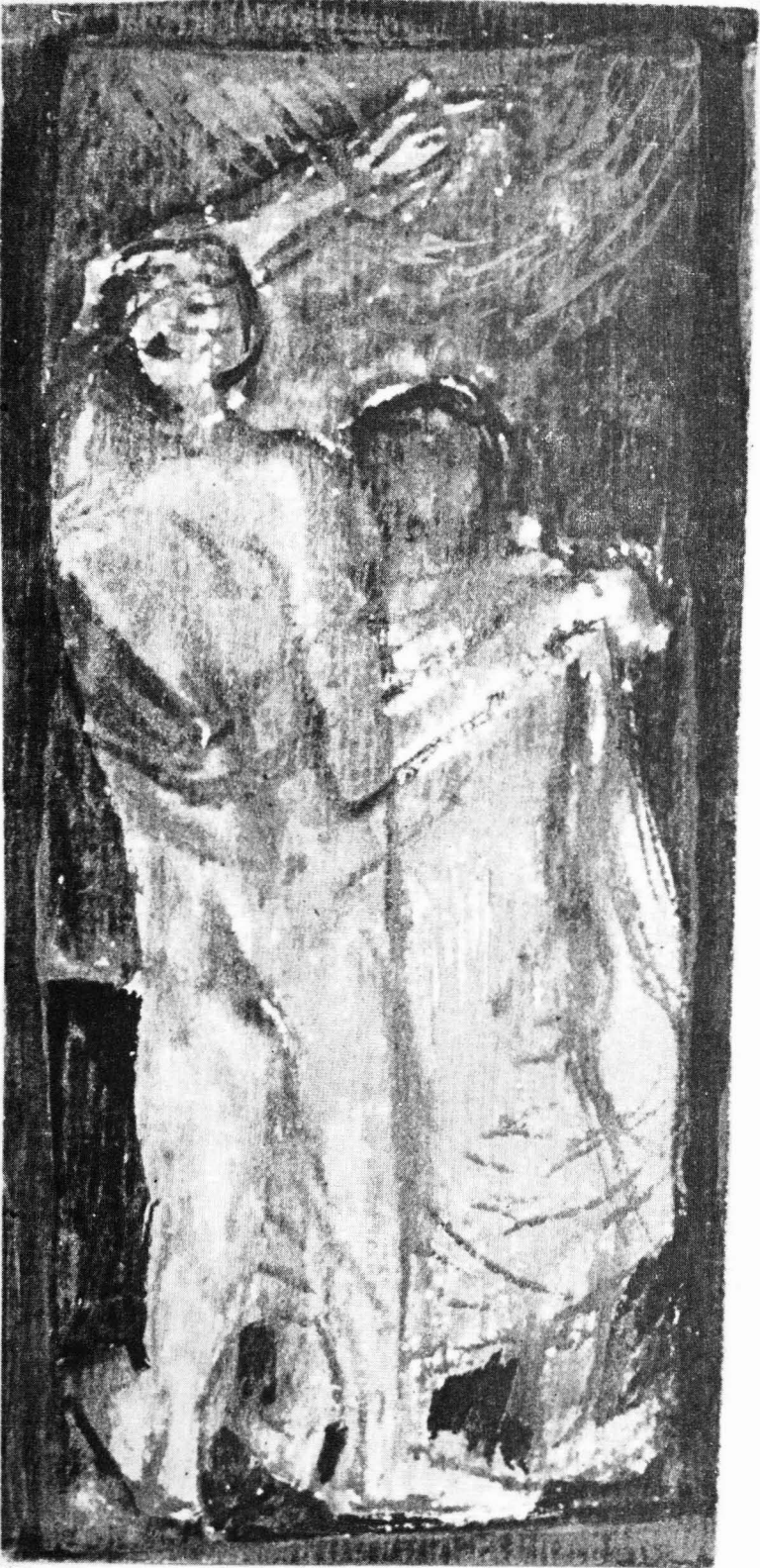
Gancz Miklós: Emberpár (1975)