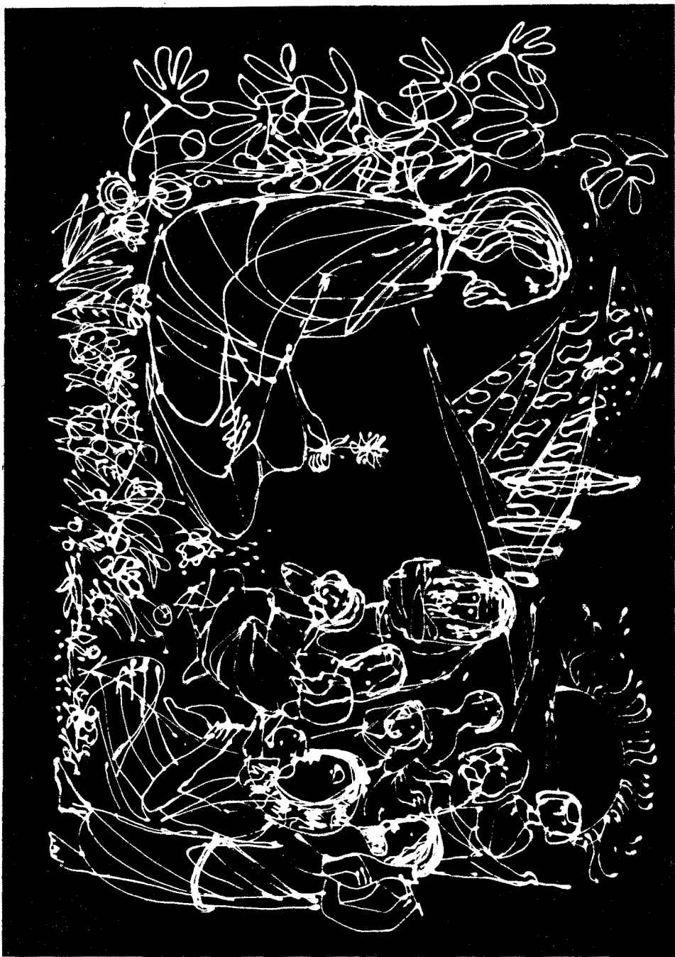
SZÁNTÓ PIROSKA festőművész: