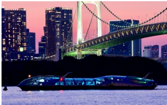
使用船舶 HIMIKO 店名 (Jicoo the floating bar)

※1 運航開始日は 旅客不定期航路事業申請の認可後 、舟運事業者HPにより公開されます。