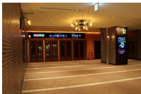
【秋】劇場エントランスロビー