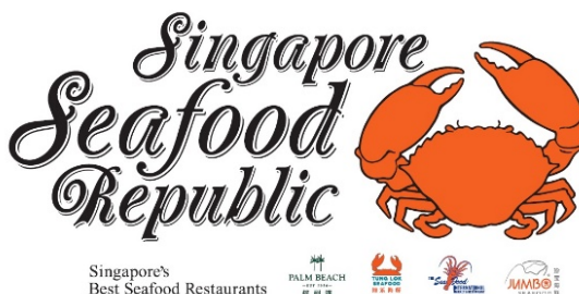
シンガポール シーフード リパブリック 東京