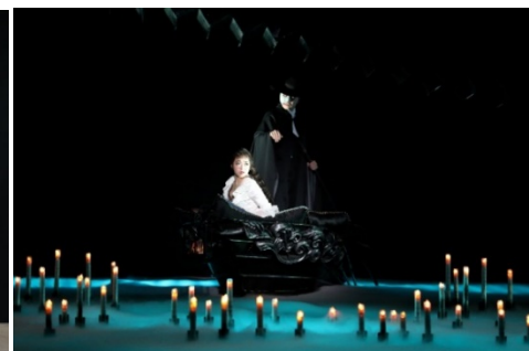
『オペラ座の怪人』