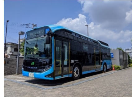
燃料電池バス外観