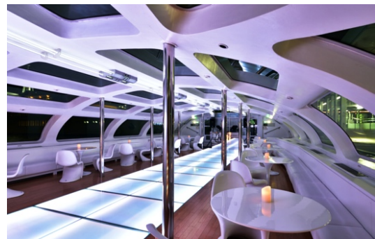
船内画像 HIMIKO 店名 (Jicoo the floating bar)