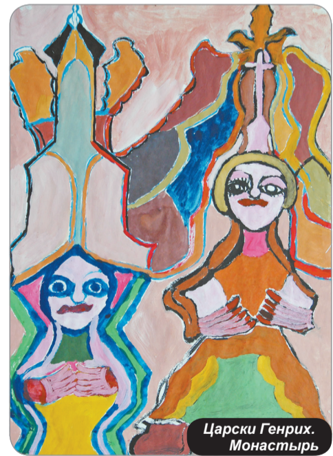
Царски Генрих. Монастырь

Не секрет, что сегодня значимость высокого искусства заключена не столько в эстетическом жесте автора, сколько в снятии любых культурных дифференций, в трансгрессивном шаге — непрерывной попытке выхода за непреодолимые пределы, за ограниченный контекст существующих правил и способов производства культурных ценностей. Последнее связано с тем или иным вариантом маргинальности: художник, творящий некие новые ценности, также как и аутсайдер, противопоставляет себя заурядным нормам. И это в определенном смысле героизирует культурный статус девиантов (по личностным характеристикам отличающихся от основной массы, – прим. ред.), а также valorизирует (повышает цену, – прим. ред.) и их творчество, ассоциирующееся уже с такими личностными качествами, как креативность, независимость, свобода воображения. Другими словами, аутсай-