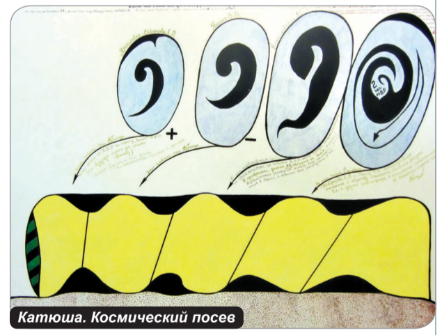
Катюша. Космический посев