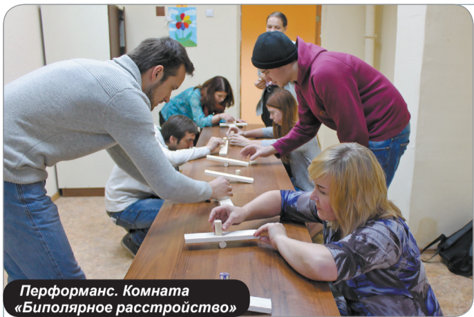
Перформанс. Комната «Биполярное расстройство»