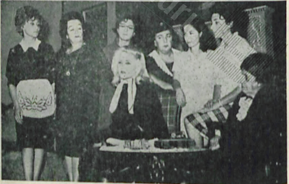
«Sekiz Kadın» piyesinde rol arkadaşları ile görüşüyor.

Tanrı tüm sanatçılara ve ailesine sabırlar versin. Ruhu şâd olsun.