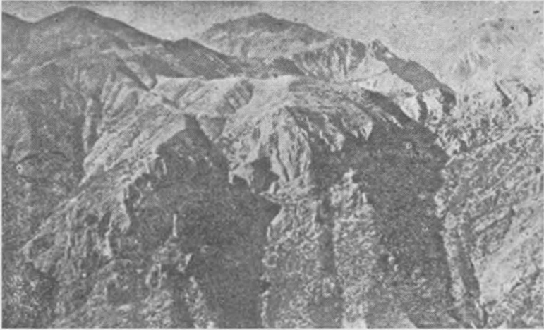
Alişirin uzun müddet sığındığı Munzur dağları ve içine girilmez mağaraları

almıştır. Çünkü Dersime gelmeden bir müddet evvel, Koçkiri'nin Armudan köyünden Mıgırdıç isminde bir Ermeniye sureti mahsusada (özellikle) İstanbula göndermiş, bu vasıta ile Seyyid Abdülkadir-den talimat almıştır.