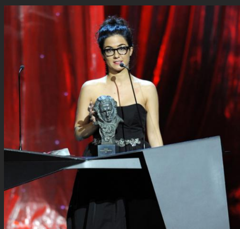
El discurso del rey

Goya de Honor/Honor Goya Award: Mario Camus