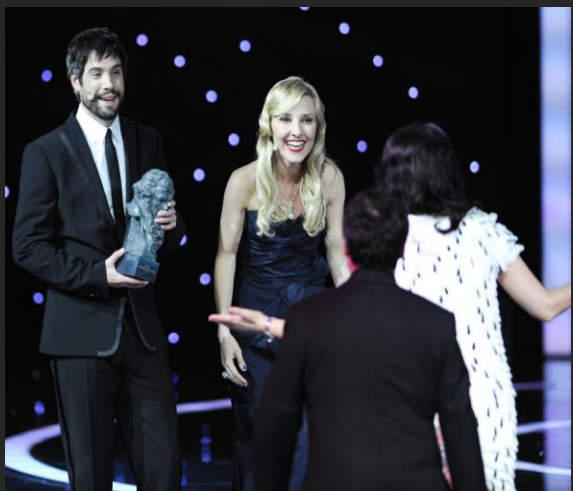
Una caja de bombones