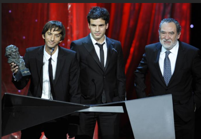
La vida de los peces

Mejor película europea/Best European Film: El discurso del rey