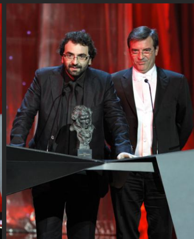
Memorias de un cine de provincias

Mejor película hispanoamericana/Best Latin American Film: La vida de los peces