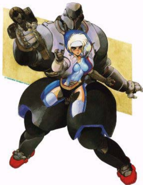
Рисунок 2. Дюна Ньют из «Appleseed» в доспехах «Landmate».

Жанры научно-фантастической полицейской процедурной драмы и дистопии позволяют Масамунэ Сиро делать своих главных героинь девушками-охотниками, целью которых является поимка и обезвреживание опасных преступников. Жанры дистопии, меха и киберпанка позволяют Сиро помещать девушек-охотников в определённую среду и давать в их распоряжение самое фантастическое оружие и не менее фантастическую технику, в том числе военную. Вообще Масамунэ Сиро фанаты любят за разработки концепций и технологий, большинство из которых столь реалистичны, что при нынешнем уровне техники стоило бы попытаться применить их на практике. Например, в манге «Appleseed» представлена его интересная разработка: боевые механизированные доспехи (powered armors), получившие название «Landmates». С точки зрения кибернетики механизированный доспех представляет собой робота-манипулятора, работающего в конфигурации master / slave (ведущий / ведомый) и не имеющего программы автономного движения. Конечно-сти «Landmate» повторяют телодвижения пилота, конечно, с небольшой задержкой и большей силой – ведь так как руки и ноги доспеха длиннее рук и ног сидящего в нём человека, то чтобы поспевать за движениями пилота, их линейная скорость должна быть выше. Единственное, о чём полагается заботиться самому доспеху – это соблюдение равновесия, то есть, он должен стоять на ногах, даже если внутри его никого нет. И такие доспехи в случае необходимости использует Дюна Ньют (рис. 2).