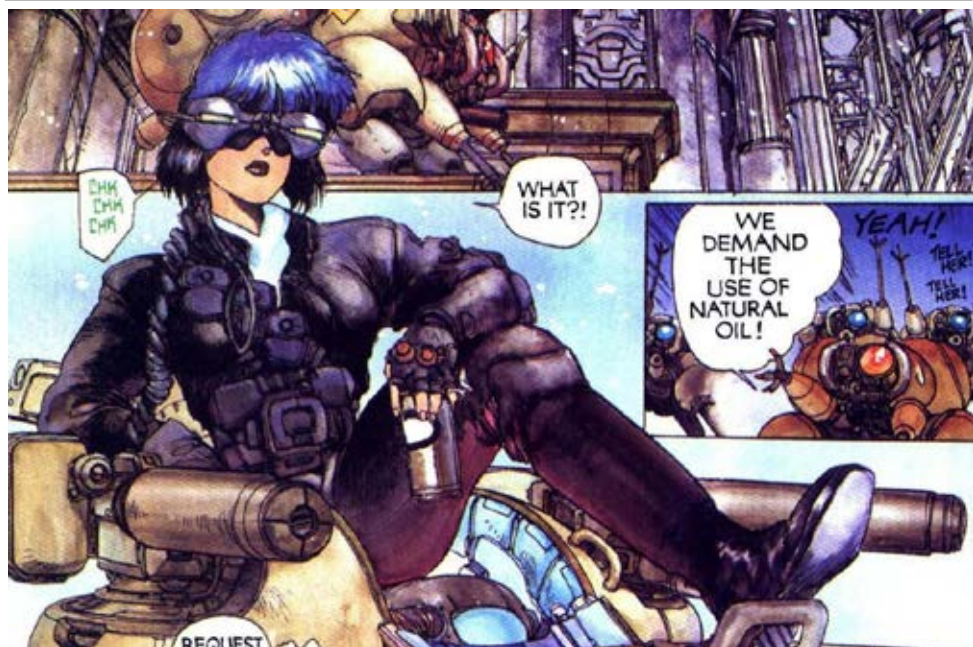
Рисунок 4. Мотоко Кусанаги. Фрагмент манги «Ghost in the Shell».

Machine Interface» (攻殻機動隊2: Manmachine Interface, Kōkaku Kidōtai 2 Manmashin Intāfēsu) [18].