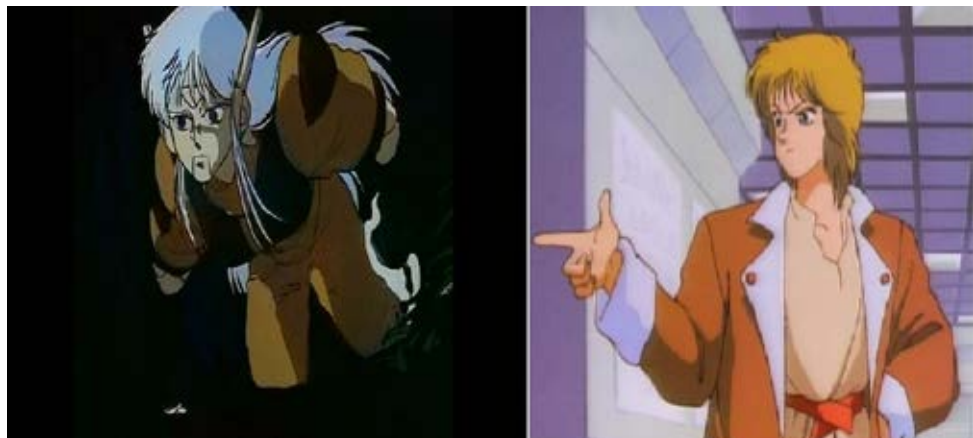
Рисунок 1. Слева – боевой киборг М-66 из «Black Magic М-66».